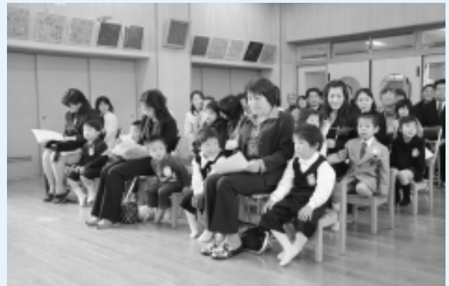
米沢保育所 (6名入所)