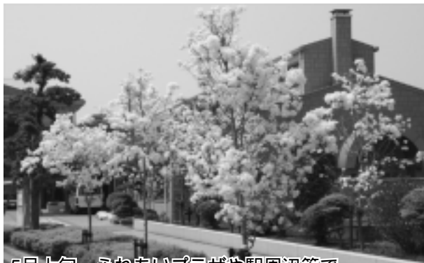
5月上旬、ふれあいプラザや駅周辺等で “花の咲くなんじゃもんじゃ”が見頃を迎えます