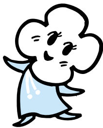
ねんきんななちゃん