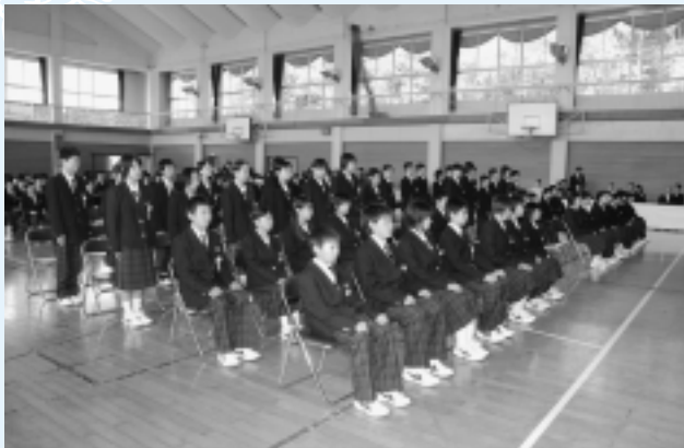
神崎中学校 (57名入学)