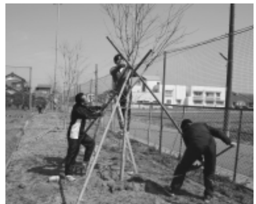
中学校の先生方によるヒトツバタゴの植樹

募金の趣旨に賛同して頂いた町民の皆さまには大変感謝しております。また、募金の取りまとめや苗木の植樹を行って頂いた各地区の区長及び世話人の皆さまには大変ご苦労さまでした。