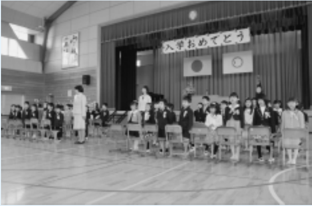
神崎小学校 (47名入学)