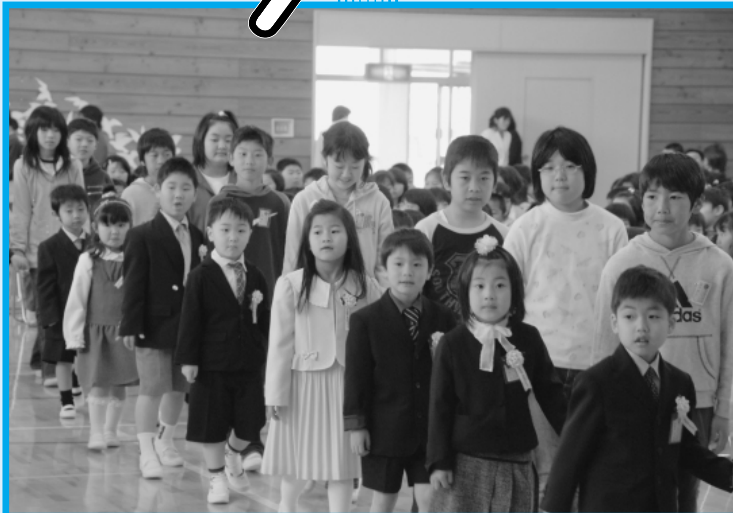
(神崎小学校入学式)