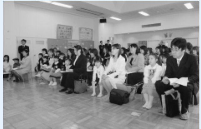
神崎保育所 (31名入所)