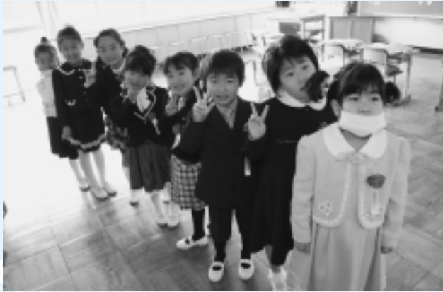
米沢小学校 (8名入学)