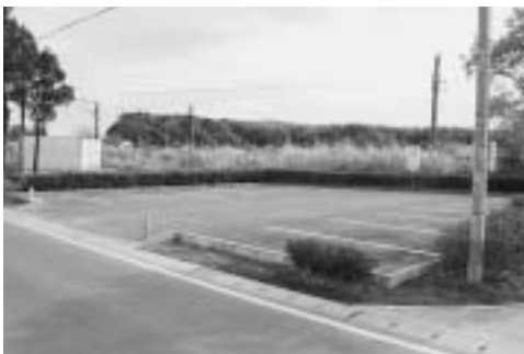
下総神崎駅前東側町営駐車場の場所