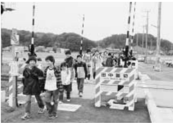
新規に整備された歩道をわたる児童たち