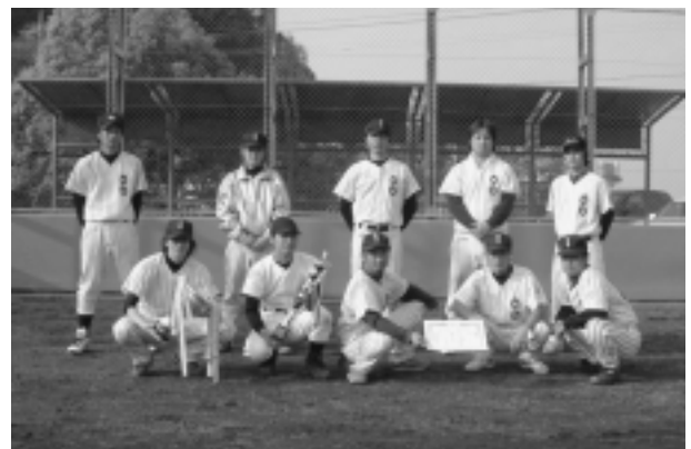
優勝したSLAPSHOTのメンバー

本大会は、町の野球連盟加盟9チームによるトーナメント方式で行われ、野球シーズンの開幕とともに、例年にもまして好試合が繰り広げられました。決勝戦は「Kaisei」と「SLAPSHOT」とで行われ、緊迫した投手戦の末、1対0で「SLAPSHOT」が優勝杯を手に入れました。