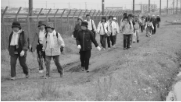
のどかな田園風景を見ながら散策