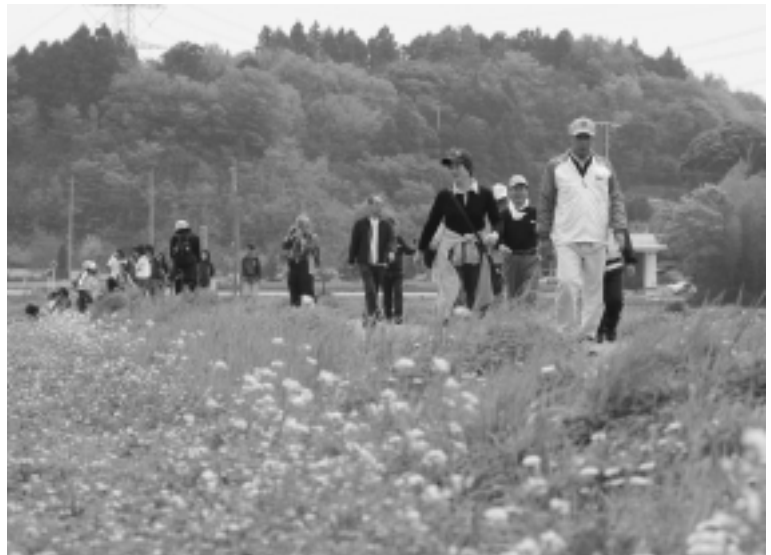
一面ピンクのレンゲと道路沿いの菜の花で心も和みます