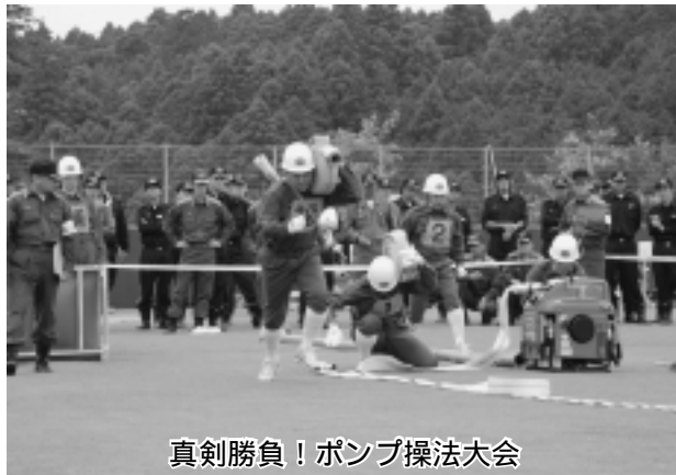
真剣勝負！ポンプ操法大会