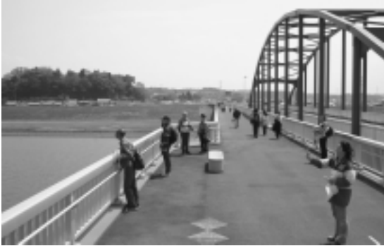
雄大な利根川の眺望を 楽しむ