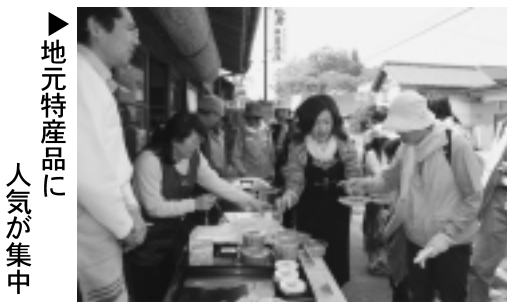
▶地元特産品に 人気が集