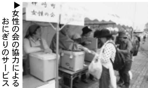
▶女性の会の協力による おにぎりのサービス

参加者は、稲が植えられたばかりの水田やレンゲの花や菜の花が咲き誇る風景を眺めながらウォーキングを楽しみました。また、コース沿いでは、地元の方々の飲食のもてなしや特産品などが販売され参加者の人気を集めていました。大勢の方の協力ありがとうございました。