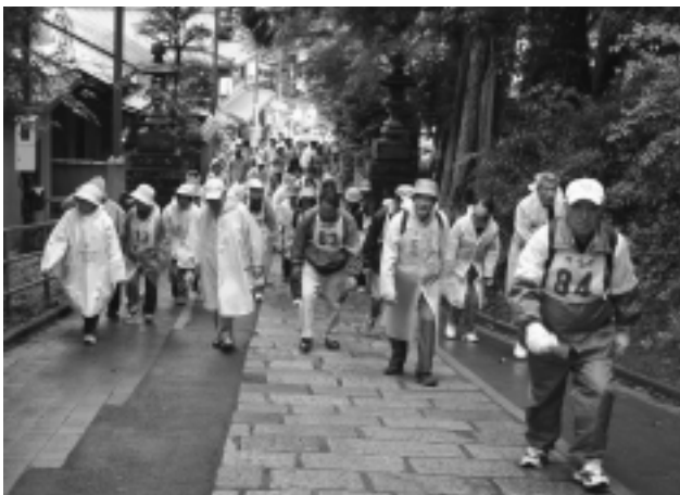
小雨が降る中、元気良く山頂を目指してスタート!!

高尾山への登山ルートは6コース。前日からの雨の影響で当初の歩行ルートを変更し、往復とも舗装路の1号路(表参道)ルートを歩くことになり、高尾山麓駐車場から薬王院を通過して山頂へ向かうルートで片道約4km。当日も小雨が降ったりやんだりの天候で、前半はきつい登り坂が続き体力も消耗気味。山頂からのパノラマも霧が発生していたため、素晴らしい景色は見られませんでした。各自豊かな自然を眺めながら高尾山の散策を楽しみました。