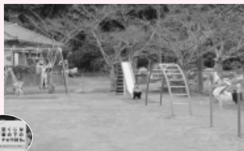
新しい遊具で遊ぶ子どもたち

子供たちの元気な声が響く、「ふれあいと憩いの場」として地域の活性化が期待されます。