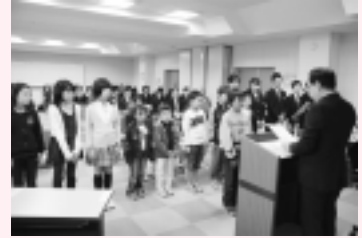
11/17に開催された表彰式

「美しくまちをつくる、むらをつくる」を課題に、神崎町を対象地とした魅力的なまちづくりデザイン競技会が日本建築学会関東支部主催(神崎町共催)で開催されました。この中で、小中学生を対象にした絵画コンクール(テーマ:私達が暮らす神崎町 - こんなまちに住みたいな)、一般を対象とした写真コンクール(テーマ:神崎町の魅力と美しさ)も同時に行われました。両部門で厳正な審査の結果、優秀賞に選ばれた作品を紹介します。また、たくさんのご応募ありがとうございました。