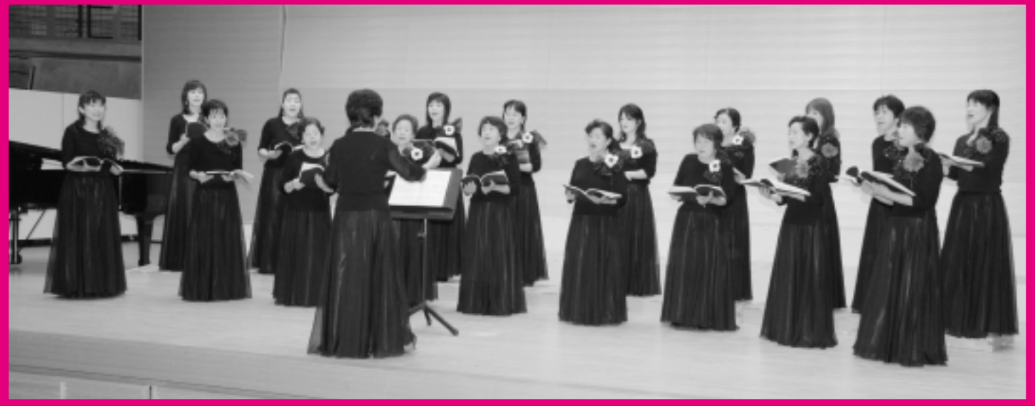
(写真 上段左：ふれあいプラザ作品展示の鑑賞、上段右：大正琴の演奏、下段：コールくすのきによる合唱、関連記事6ページ)