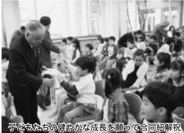
子どもたちの健やかな成長を願って合同紐解祝