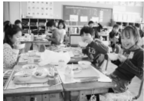
楽しい給食の時間です

給食が提供できるよう改善され、現在に至っています。本町の学校給食には大きな特徴が二点あります。一つは強化磁器製の食器の使用です。この食器は家庭で使用している食器に近く、児童生徒がおいしく食べるための助けになるばかりでなく、食事のマナーを学び、物を大切にすることを養う上でも大きな効果があります。もう一つは食器洗浄機です。洗剤の代わりにイオン水を使用する環境にやさしい方式が採用されています。献立の作成にあたっては、栄養士が各学校に向かい、食育の指導を念頭におきながら、児童生徒の栄養バランスに配慮し、季節の食材、児童生徒の嗜好等も取り入れ、バラエティに富んだ献立につと