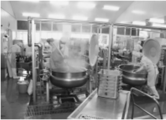
清潔で衛生的な施設から バランスのとれた給食をつくっています