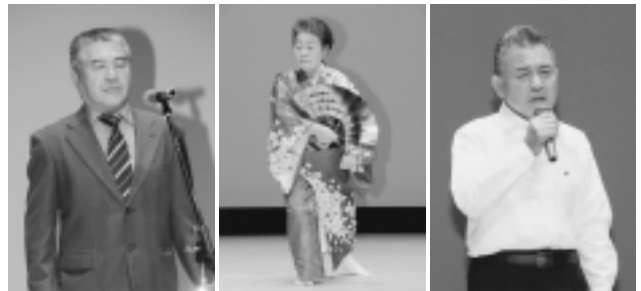
多彩な芸能がたくさん披露された芸能発表会