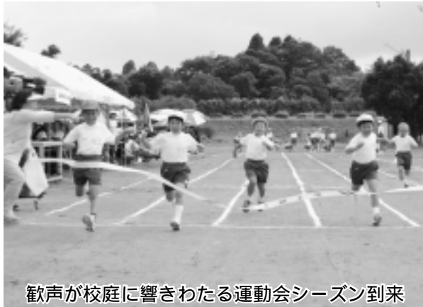
歓声が校庭に響きわたる運動会シーズン到来