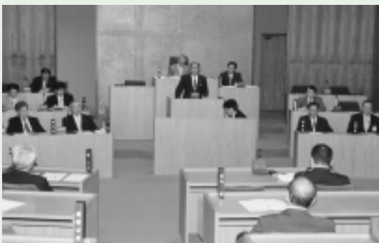
▶ 就任のあいさつをする

このほか、香取広域市町村圏事務組合議会、千葉県後期高齢者医療広域連合議会の各議員が選出され、閉会しました。