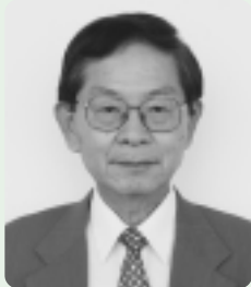
渡邊 徹 議員