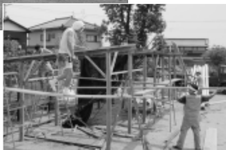
建設業協会の方による施設の 修繕作業の様子