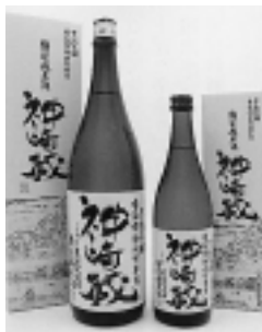
▶ 神崎町産総の舞使用の特別純米酒「神崎蔵」

製品は香りの高い大吟醸酒から純米酒・本醸酒・普通酒・生酒に至るまで150種類以上の製品を出荷しています。また、ご当地清酒として地元のみを使用してお酒も造っています。製造面での最大の特徴は、平成9年より杜氏や蔵人による酒造りから脱却して、社員全員での酒造りに方向転換をしたことです。