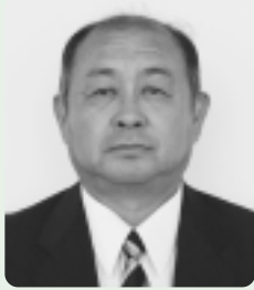
第20代議長 寶田久元 議員