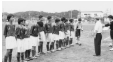
大健闘したサッカー部のメンバー