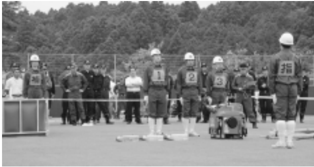
関係者が見守る中、ポンプ操法の開始