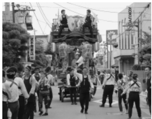
◀ たくさんの人で賑わう山車の曳き廻し