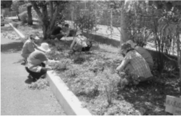
ふれあいプラザ駐車場の雑草を取る女性の会の方