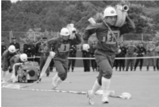
▶全員一丸となって 操法演技を披露