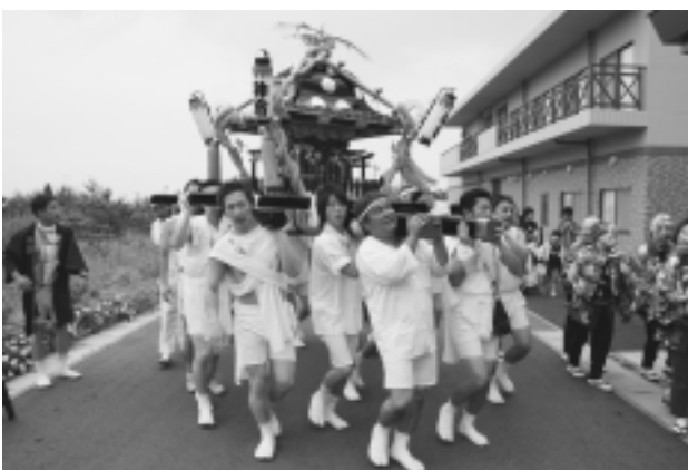
元気が一番 神宿の祇園

7月は夏祭りの季節です。町内では無病息災、五穀豊穡を祈願する祇園祭りが各地区で行われました。特に7月21日から23日の3日間にかけて行われた本宿地区の祭礼は、町内でも一番の賑わいをみせ、繰り出した神輿や山車がたくさんの見物客を魅了しました。