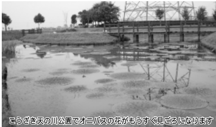
こうぎき天の川公園でオニバスの花がもうすぐ見ごろになります