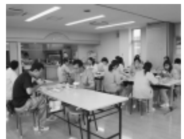
なごやかな雰囲気できし事をするスタッフ