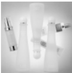
▶スキンケアの商品

また、スタッフの健康維持管理のため、食堂が完備されており、昼食はみんなでおしく食べていると教えていただきました。