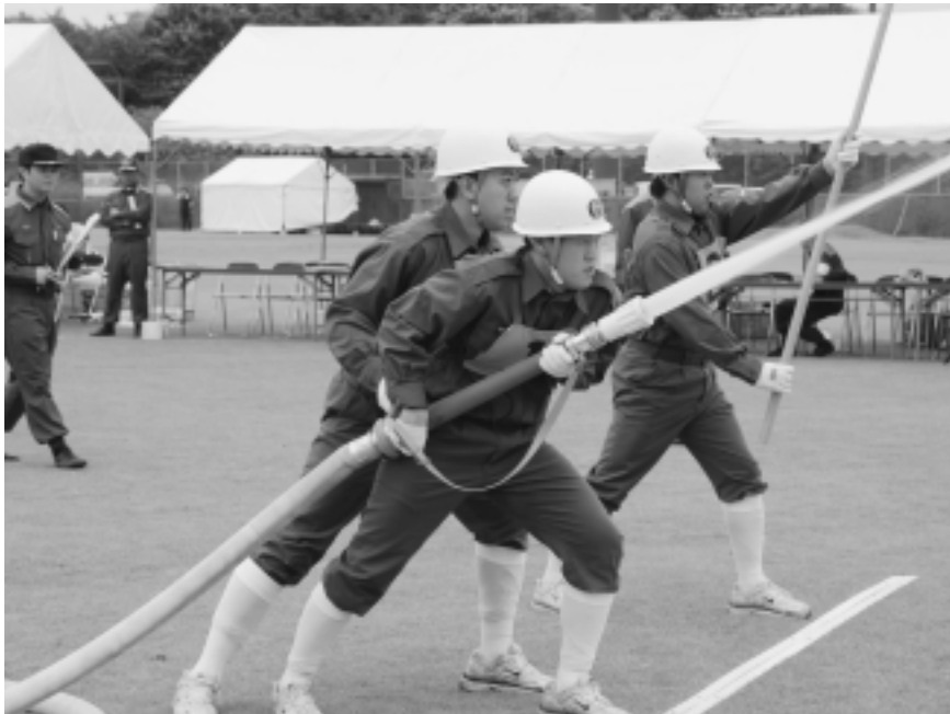
火点の標的に放水!

なお、優勝した神宿班は香取支部の代表として7月28日の県操法大会に出場しました。