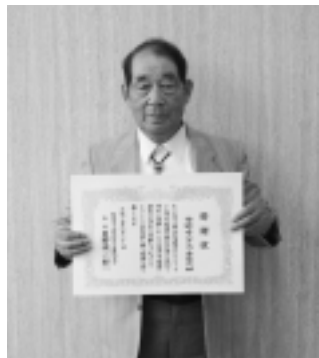
表彰を受けた 神崎町老人クラブ連合会

同連合会は、毎年、神崎大橋を中心に利根川堤防のゴミ清掃を行っており、その功績が認められたものです。いつも河川の景観美化に努めていただき本当にありがとうございます。