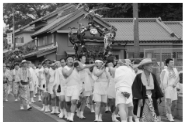
熱気がいっぱい 本宿の祇園