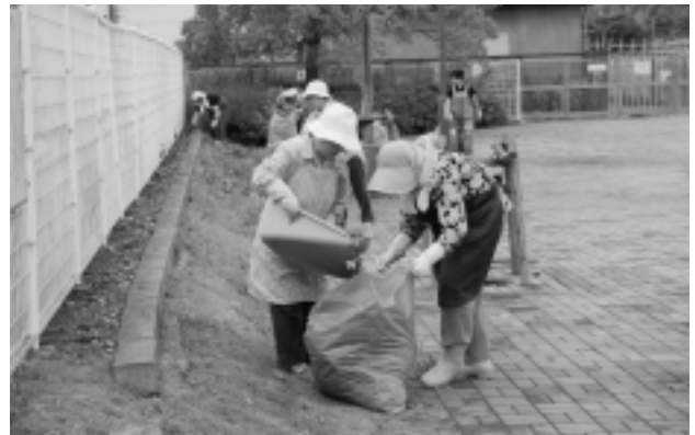
駅北口周辺の清掃作業をするポプラ会の皆さん

「女性の会」はふれあいプラザ駐車場の植え込みの除草、「ポプラ会」は下総神崎駅北口広場周辺の除草、「校友会」は駅南口ロータリーの花壇に花の植栽などが行われました。みなさんの協力によりきれいな町になり、ありがとうございました。