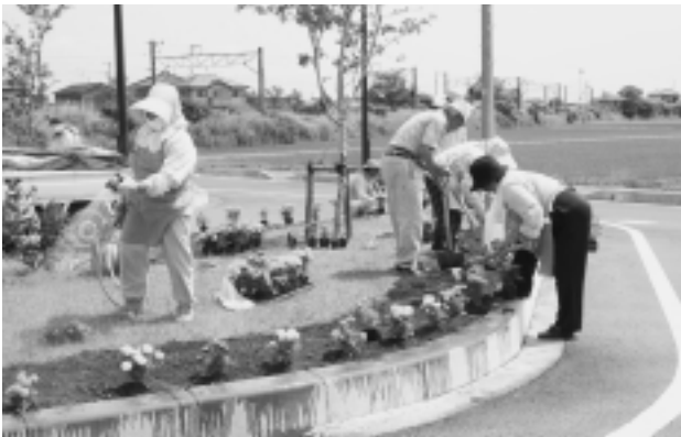
駅南口ロータリーの花壇に花を植える校友会のメンバー