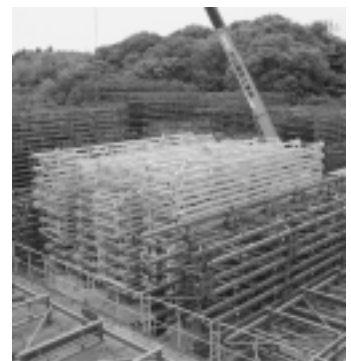
保管場所にたくさん積まれたラック