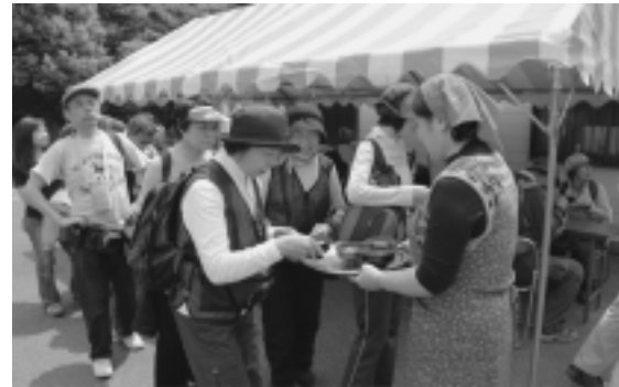
きたふれあいセンターで 手打ちそばのふるまい