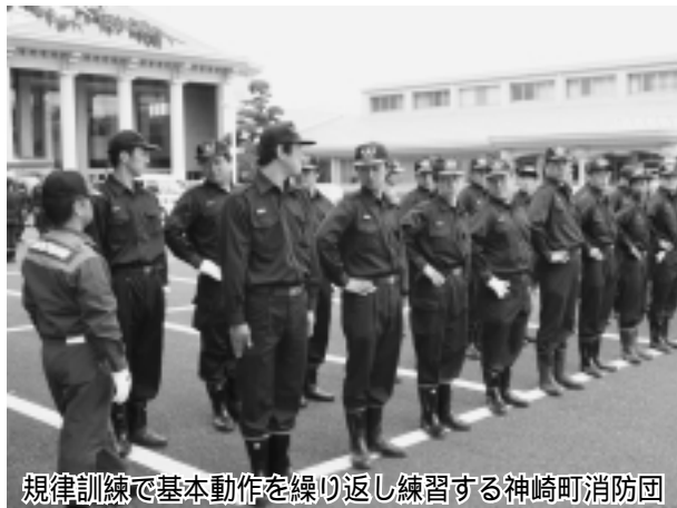
規律訓練で基本動作を繰り返し練習する神崎町消防団