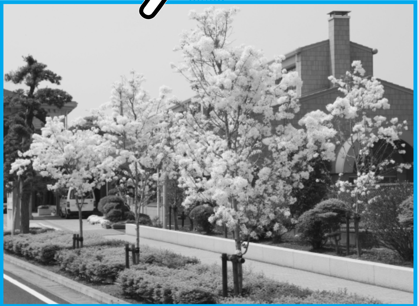
(平成17年11月、神崎ふれあいプラザ駐車場に植樹)