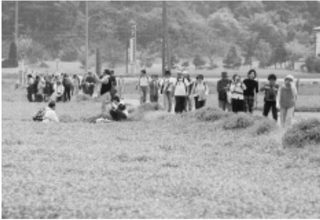
満開のレンゲ畑で写真を撮り、気分もリラックス