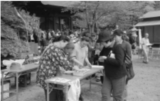
おかべ観音では 筒などで歓待