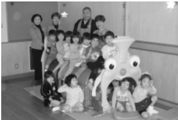
贈られた遊具で遊ぶ米沢保育所の園児とボランティア連絡協議会の役員の方