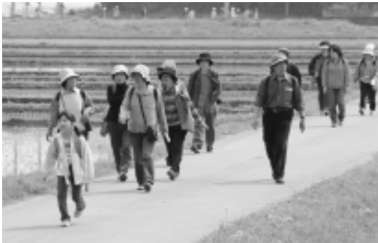
稲が植えられた水田を見ながらウォーキング

参加者は、のどかな田園風景や歴史探訪を満喫し、ボランティアのもてなしに喜び、さらに満開に咲いたレンゲの花は、大勢の人の目を楽しませていました。また、地元特産品販売や抽選サービスにも人気が集まっていました。