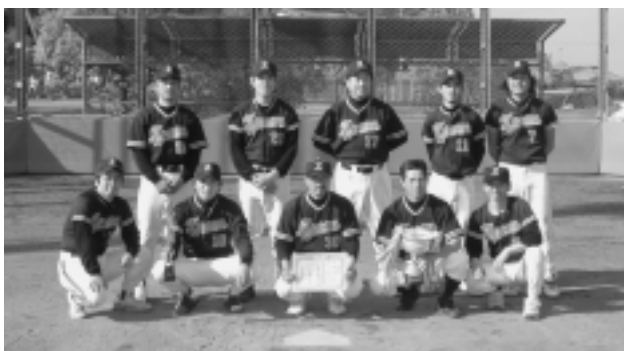
優勝したズームスのメンバー