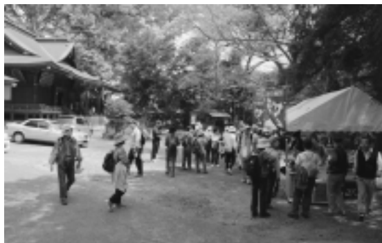
境内で手焼きせんべいの 試食や冷たい甘酒で歓迎