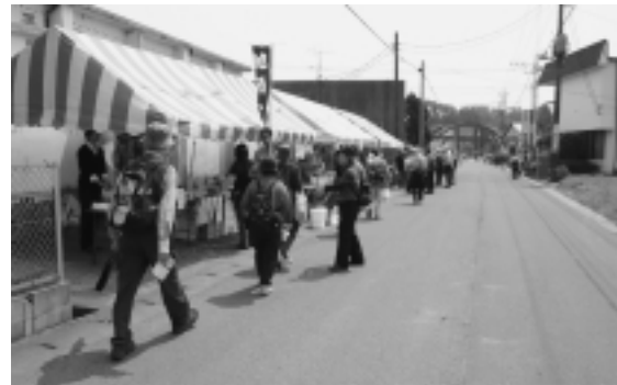
人気が集めた 地元特産品の販売