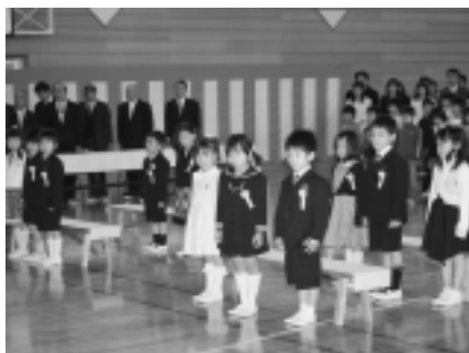
米沢小学校 (11名入学)