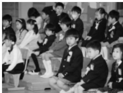
神崎小学校 (51名入学)