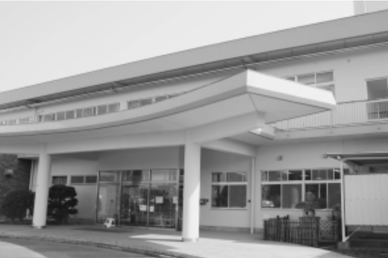
リニューアルしたわくわく西の城

平成17年4月からスタートしたわくわく西の城。皆さまにご利用いただいている施設は、昭和52年に建築された建物で、雨漏りや漏水等老朽化が進んでいました。このため、平成18年度に施設の改修工事を行い、リニューアルしました。これからもたくさんの方々のご利用をお待ちしています。