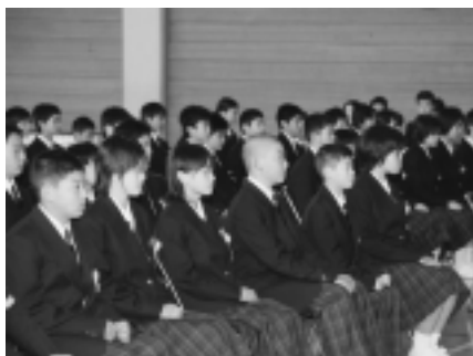
神崎中学校 (69名入学)