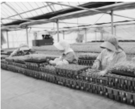
野菜の苗をポットに移植する会員たち