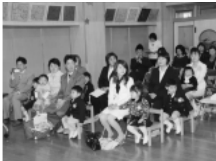
米沢保育所 (8名入所)