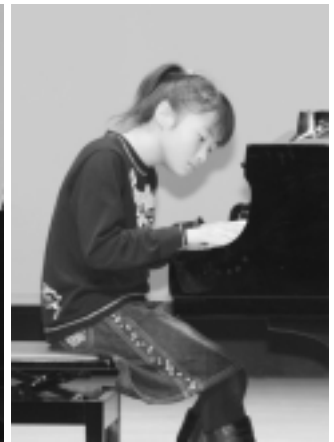
素晴らしい演奏が次々に発表されたピアノ演奏