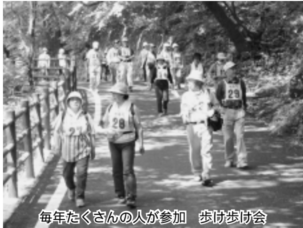
毎年たくさんの方が参加 歩け歩け会