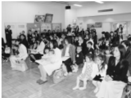
神崎保育所 (32名入所)