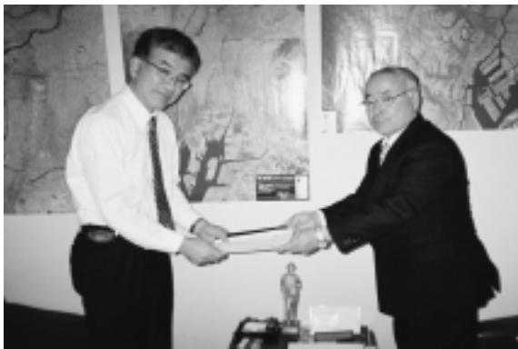
国土交通省門松河川局長へ要望書を提出