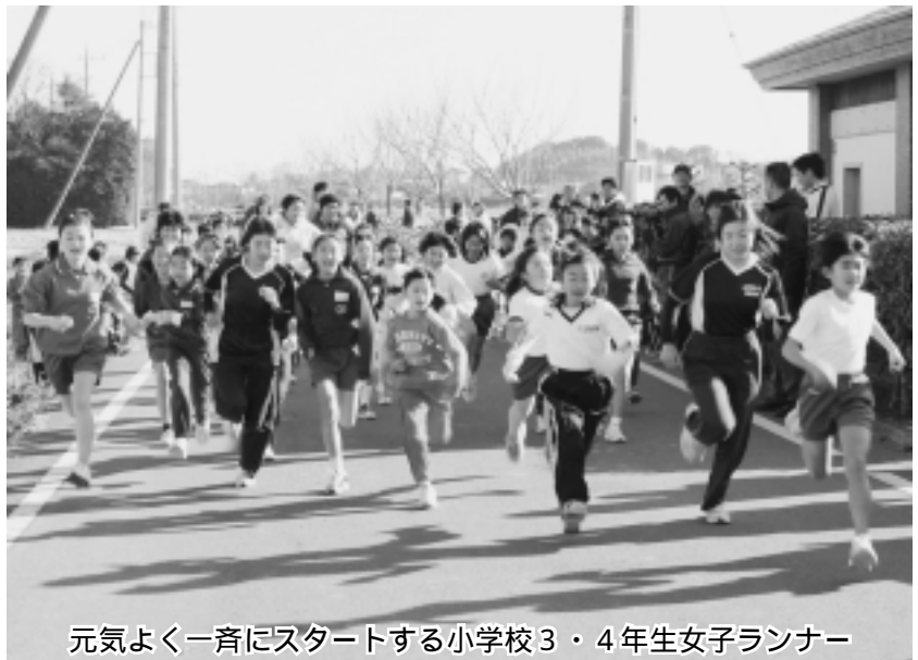
元気よく一斉にスタートする小学校3・4年生女子ランナー