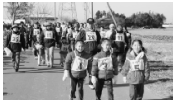
軽やかな足取りでウォーキングもスタート!