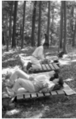
大地に寝転び気分もリラックス！