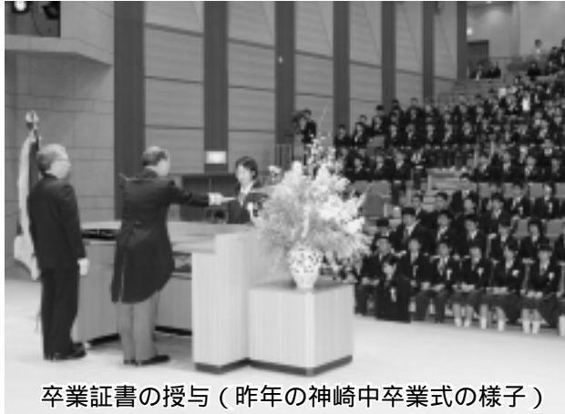
卒業証書の授与（昨年の神崎中卒業式の様子）