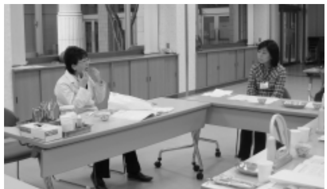
口腔や栄養改善セミナーを開催

◎お問い合わせ 神崎町地域支援包括センター（ふれあいプラザ保健福祉館内） ☎ 1607