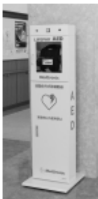
▶AEDの入った白いBOXをふれあいプラザのロビーに設置