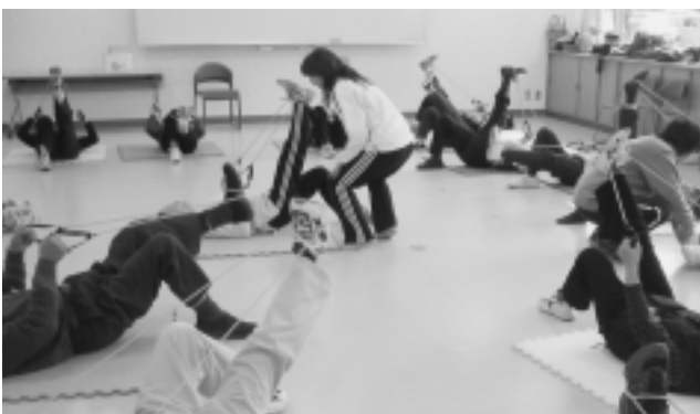
ゴムチューブを使って足腰の筋力アップ