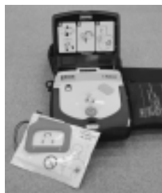
突然の心臓停止から命を救うAED

寄贈されたAEDは、ふれあいプラザ、各小中学校へ設置をしました。ありがとうございました。