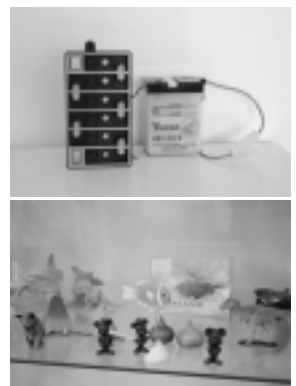
バッテリーの接着剤(上) や試作モデルの模型(下)

町民テニスコートにも使用されています。さらにISOを取得し、品質や環境の向上に努め、各業界の要求に合わせた製品を製造するオンリーワンの会社です。