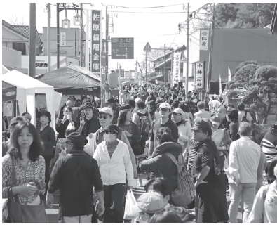
5年ぶりの開催を目指す酒蔵祭り

進めていくこととなります。 次に、去る11月23日に、神崎ふれあいプラザを会場として、なんじゃもんじゃいさいき発酵フェスティバルが開催されました。今年は晴天に恵まれ、関係団体の皆様のご協力により、今までにない人手で賑わいました。また、長い間開催を見合わせておりました「酒蔵まつり」も、今年度は3月17日に、実に5年ぶりに開催する方向で準備をすすめております。「発酵」をテーマとしてまちづくりを行っている神崎町で、最も象徴的かつ規模の大きなイベントです。盛会裏に事業を実施できますよう皆様のご協力をお願いできればと思います。