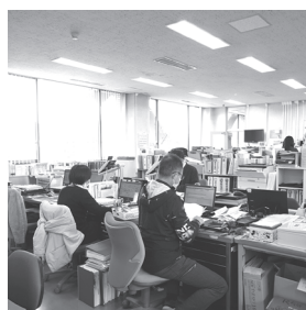
84人の会計年度任用職員が働いています

保健福祉課長 会計年度任用職員に担任をお願いする時は、他の人より上位の号級の報酬を支給しています。