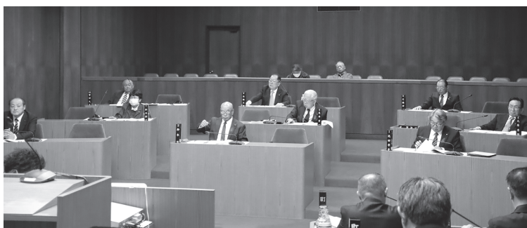
第5回定例会の様子

◎令和5年度神崎町一般会計補正予算(第5号) 既定予算に1550万円を追加し、総額を36億1330万円とするもので、歳出の主なものは、重度心身障害者医療費助成事業として、医療費給付金235万円増額、新規事業としてオーガニック推進事業費26万円、小学校教科書改訂による指導書購入費632万円などです。