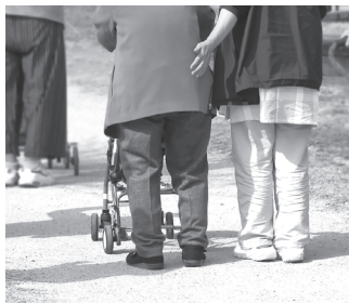
介護サービスのニーズは年々増加傾向

保健福祉課長 業務を超えた要求が増えるのではという懸念から2027年まで見送りのことです。