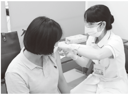
ワクチン接種の様子

問 欧米諸国と比べて、日本の3回目のワクチン接種は大きく遅れた。感染者がまん延する前にワクチン接種しなければ、意味がないのでは。抗体値が50%を割るのは、6か月くらいとの話も聞く。2月に3回目の接種をするなら、4回目は8月になる。その準備は考えているのか。 保健福祉課長 現在、3回目の接種に職員そろって注力しており、厚生労働省から4回目の接種の具体的な情報は提供されていません。 問 国の方で、はっきりとしたことを言ってくれないなら、自治体の方から要望してい