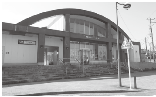
完成から24年神崎ステーションホール

問 ステーションホール防水改修工事の概要は。まちづくり課担当課長 ステーションホールのトイレの天井に雨漏りが見られまして、トイレ部分の屋根に防水工事を実施します。