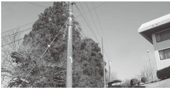
庁舎西側・伐採箇所

答 役場庁舎西側には、役場庁舎配電設備・キュービクル・非常用発電設備等が設置されており、これらに通電する電線は庁舎の電気の源となっております。その電線よりも西側樹木の高さが高く、台風等の強風の影響で重要設備を破損させる恐れが出てきております。これまでに、職員対応で切れる範囲で剪定を行っていましたが、大規模な幹の伐採が必要であるため、業者による伐採工事を予定しております。