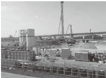
仮称神崎パーキングエリア工事

問 圏央道の4車線化に伴い道の駅に隣接するパーキングエリアが3年後にでき、2日3000台の駐車台数が見込まれているようだが、接続料は発生するのか、また道の駅も拡張しなければならぬのでは。