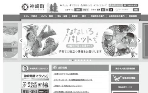
トップページ画像