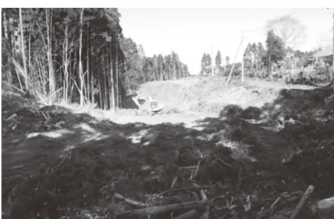
古原地先工事箇所

答 本事業は、災害により道路や送配電線等の重要インフラ施設が、風等による倒木被害により機能停止することを未然に防ぐため、高木を伐採し特殊地ごしらせを行い、風倒被害を受けない中低木を植栽する事業となります。令和2年度は0.72ha、3年度は0.43haの特殊地ごしらせ工事を行い、令和4年度は、1.15haに中低木の植栽を実施する予定です。