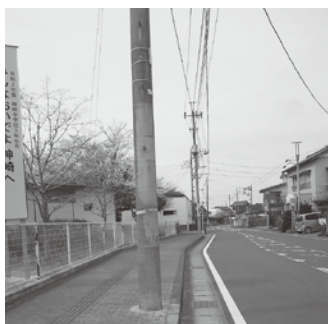
町道に建つ電柱等が対象

国が令和2年度、千葉県 が令和3年度にそれぞれ消 費税率の引上げ等に伴う道 路占用料の改定を行ったこと を受けて、本町においても国、 県に準じて道路占用料の改 定を行うものです。