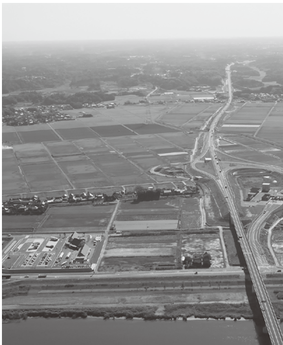
神崎ICと道の駅(オープン当時)

町長 現在、いちごハウスが周辺地域で一番いい場所に入っております。観光目的として道の駅への寄与もある。他の企業誘致は、具体的には見えておりませんが、飲食店(コーヒーマ、食堂等)であったりしますが少しずつ始めたいと思っています。また、町民から一番要望のあった「公園」を設置したいと思っています。予算のかかることなので、順次進めていきたいと思っています。