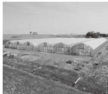
観光いちごハウス

り、収益性を上げる。農地の転用については、空港周辺地域での特別措置として国へ、また千葉県への要望も行ってあります。