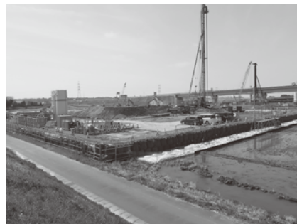
進むパーキングエリア工事

問 令和6年度に圏央道パークینگが、完工になると報告されましたが、町の予算では、設計のための予算として盛り込まれていないが、パークینگ関連では盛り込んでいません。また、町の「第5次総合計画」にはハイウェイオアシスの計画で道の駅周辺が商工地域になっております。現在は農業地域であること、区分の変更等来年度より準備に入っていないじゃないか。