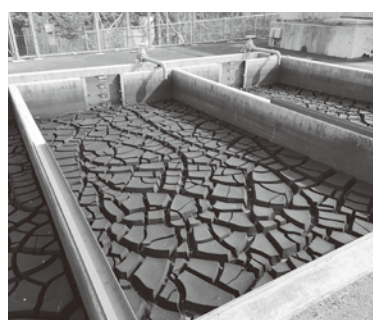
浄水過程からの発生土

つの方向から情報を探すとができ、利便性も向上しスマートフォンやタブレットの画面に対応したデザインで制作をしたところが大きな特徴です。