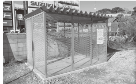
神崎神宿に設置されたごみステーション

総務課長 要望に対しては、全て対応している状況ですが、予算措置が取れないものについては検討中になります。