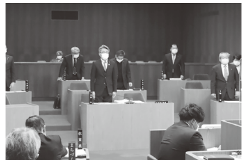
予算案採決の様子