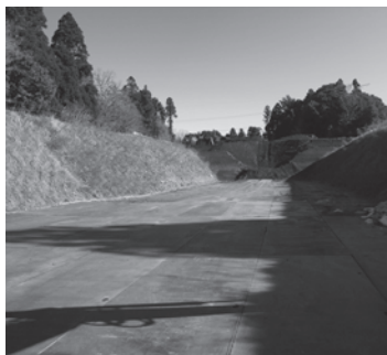
成田神崎線(成田市側)

仮オープンさせて通れるというような検討する必要があるのかなど。何らかの成果を出す必要があると考えています。