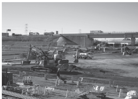
パーキングエリア建設工事

問 パーキングエリアの管理を町や道の駅で引き受けられないのか。(駐車場・トイレの清掃、ゴミの処理)