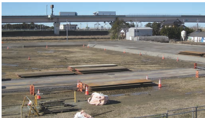
パーキングエリア建設予定地