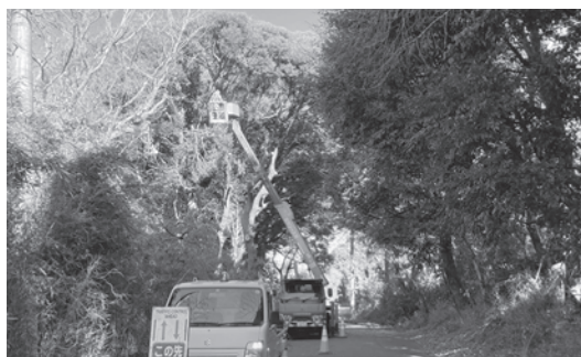
樹木の伐採の様子

問 大貫地区の児童が通う白旗神社脇のS字カーブは木が生い茂つて昼でも暗い。枝払いはやらないのか。歩道は。