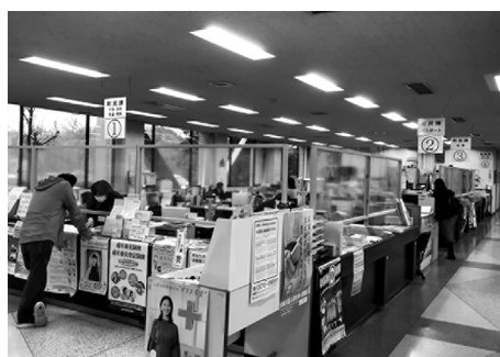
飛沫防止対策を講じたカウンター

し、休業要請等協力金として1事業所当たり10万円を、町単独事業として支給するための補正です。