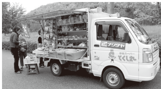
移動スーパー・とくし丸

問 昨年からは始まった高齢者の買い物に便利な、移動スーパーの状況はどうなっていますか。