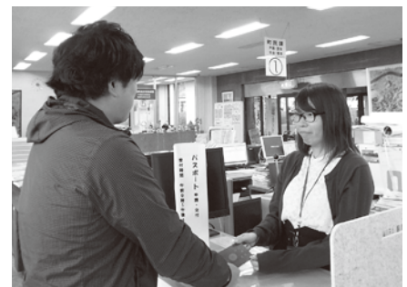
パスポート申請の様子

現在女性用のトイレは、全部で7か所あります。今回の工事では、3か所の和式トイレを洋式トイレに改修いたしますので、工事後は、合計7か所のトイレの内、洋式トイレが5か所、和式トイレが2か所ということになります。