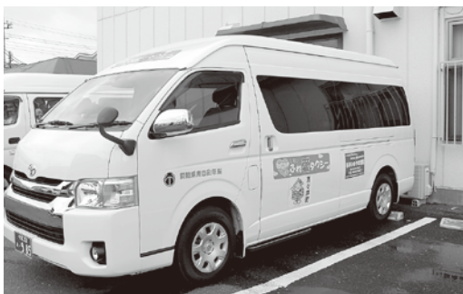
しすい・ふれ愛タクシー

問 近隣の酒々井町では、検討委員会を立ち上げ、現状把握や近隣市町の状況を調査し、比較検討、町民アンケートの結果、乗合タクシーが勝れた方式だと結論したようです。神崎町でも検討委員会だけでも。