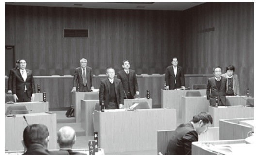
予算案の採決のようす

平成31年度予算は3月6日に上程され、7日に総務文教常任委員会、8日にまちづくり厚生常任委員会で審査を行い、14日に各常任委員会委員長による総括質問と討論、採決が行われて全て原案のとおり可決されました。