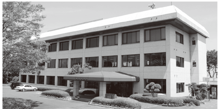
耐震工事をする役場庁舎

問 給食の正職員を1人減らすことにより、調理は大丈夫なのか。また、今後、給食を外部委託する予定はないのか。