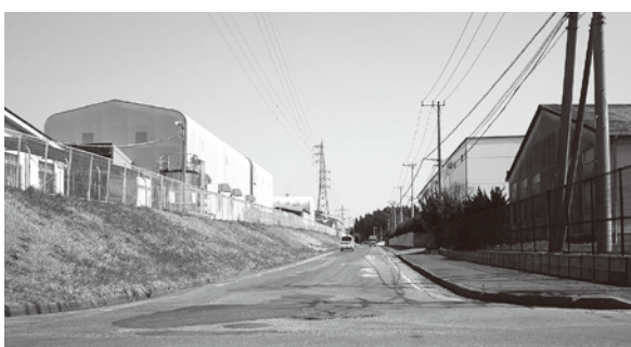
武田毛成線修繕箇所

道路の修繕の基準につきましては、平成29年度に実施しました、路面性状調査の結果から、区間延長200m以上