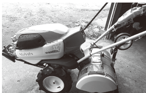
補助事業で購入した管理機

道の駅で葉物・果菜類等の売り上げを10万円以上増加できるように作付けしていただくことを要件とし、上限10万円の1/3補助となっております。