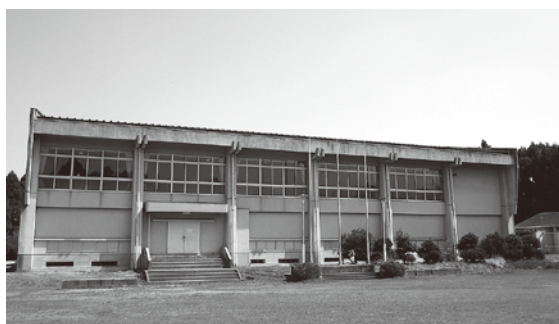
わくわく西の城体育館

歳出の主なものは、総務費で役場庁舎とわくわく西の城の耐震改修事業により23.8%、1億1601万6千円の増額、土木費で新規の橋梁長寿命化修繕事業などにより17%、2891万5千円の増額、教育費で町民体育館耐震改修設計業務委託の完了により97%、2797万6千円の減額となっております。その他は前年と大きな差異はありません。