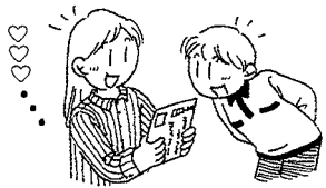
「お電話をお待ち申し上げます。」