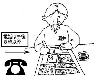
電話は午後8時以降