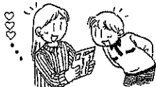
「お電話をお待ち申し上げます。」