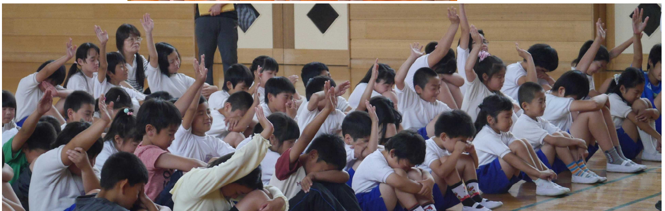
プールをとっても楽しみにしている子どもたちがこんなにたくさんいます