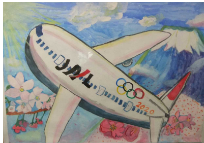
成田空港展佳作 2年 飯田みのり