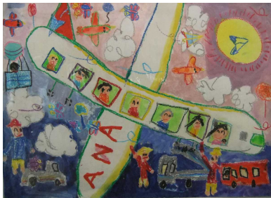
成田空港展金賞 2年 飯田雅也