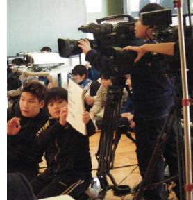
カメラさんオーケーですか？