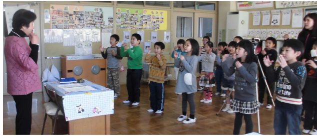
1・2年の皆さん上手です