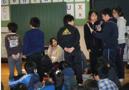
さあ米沢小の出番です

2月10日(火)に神崎小との交流の一環として、5年生がTBS出前授業においてアナウンサー・カメラマンなどの体験をしました。実際にテレビ局で放送にかかわっているプロの人たちによる指導は、子どもたちにとってよい経験になったと思います。将来、自分もやりたいと思ったのではないのでしょうか。