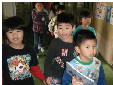
いい表情 だいぶ慣れてきたかな！