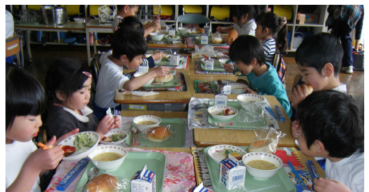
初めての給食！おいしそうだね