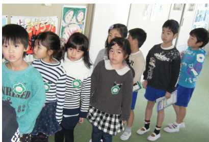
ちょっと不安そう 大丈夫だよ

来年度入学する子どもたちと1・2年生との交流会を12日(木)に行いました。8人の園児が体験に来ましたが、入学予定者は5名です。低学年の子どもたちととても楽しそうに交流していました。4月に入学してくるのが今から楽しみです。