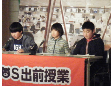
米沢小ニュースです！