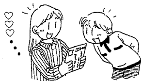
「お電話をお待ち申し上げます。」