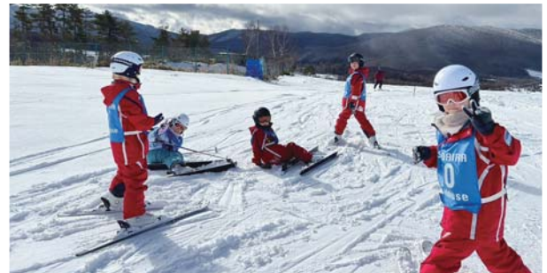
▲みんなで麓まで滑るぞ！

2日間のレッスンでは天候に恵まれ、白く雪に覆われた山々と抜けるような青空のコントラストをバックに、参加者たちは思う存分スキー・スノーボードを楽しみました。