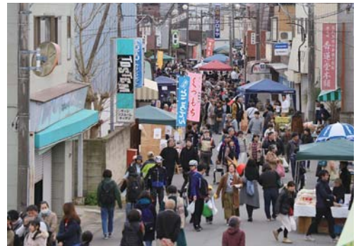
▲大勢の人で賑わう河岸通り

※規制期間は上記のとおりですが、規制期間前後は、準備・片付けの関係上路上が混み合うため、迂回をお願いする場合があります。