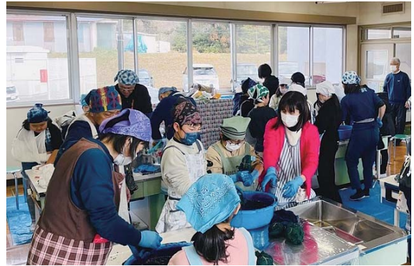
▲藍染めをする米沢小教員と児童たち