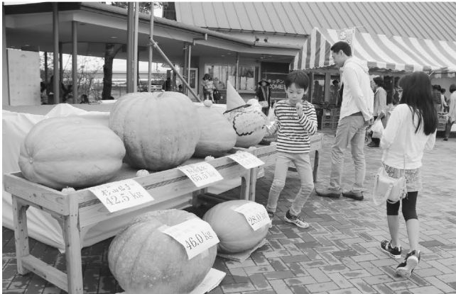
子どももびっくりのジャンボかぼちゃコンテスト