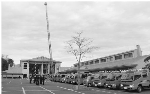
機械器具点検の様子