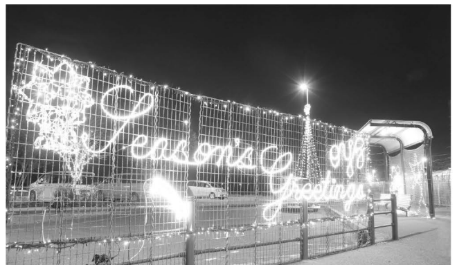
今年も南口を「おやじの会」が装飾してくれました