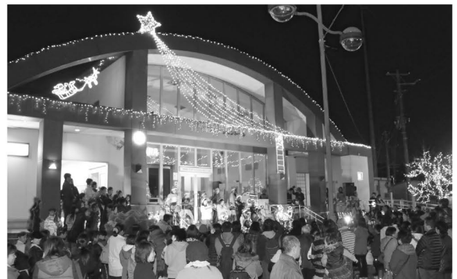
たくさんの来場者が集まった点灯式

点灯期間は来年の1月9日までで、毎日16時30分から23時30分まで点灯しています。今年は、新たに「かぼちゃの馬車」が登場。写真スポットとしてお楽しみいただけます。ぜひお越しください。