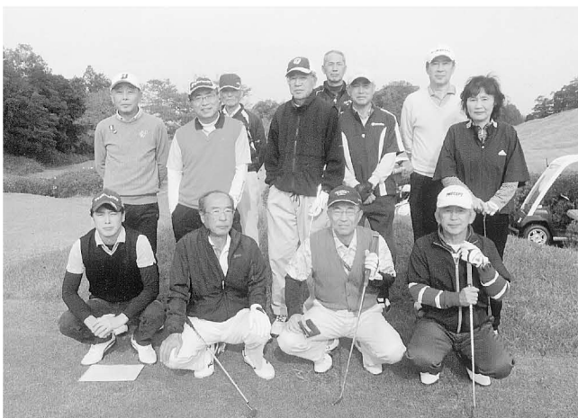
霞南ゴルフ倶楽部での記念大会