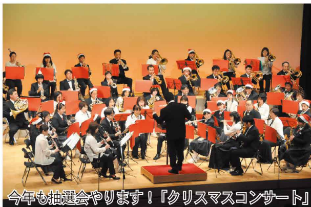
今年も抽選会やります！『クリスマスコンサート』