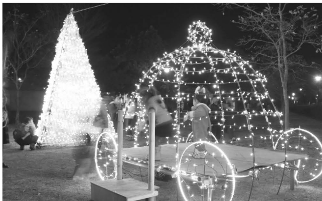
今年新たに設置した「かぼちゃの馬車」