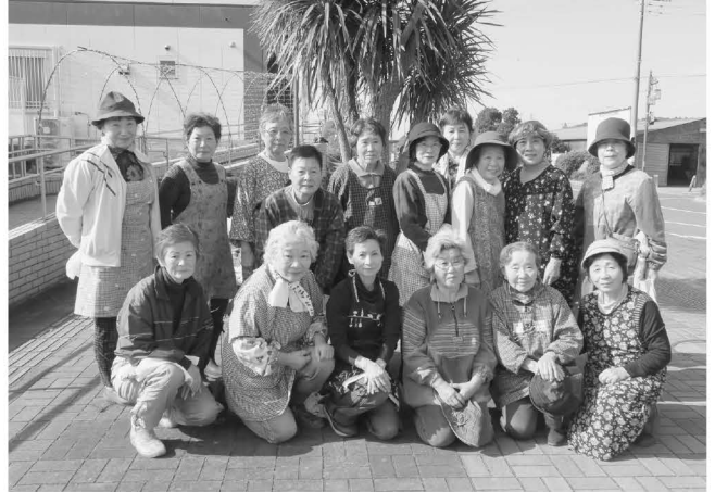
11/6 ポプラ会清掃活動（駅北口広場）