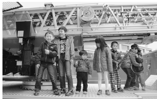
はしご車で記念撮影する子ども達