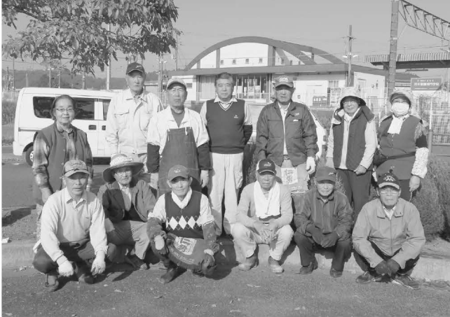
11/6 校友会植栽活動（駅南口ロータリー）

J R下総神崎駅で校友会とポプラ会が、6月と11月に植栽活動と清掃活動を行いました。環境美化にご協力頂きありがとうございました。