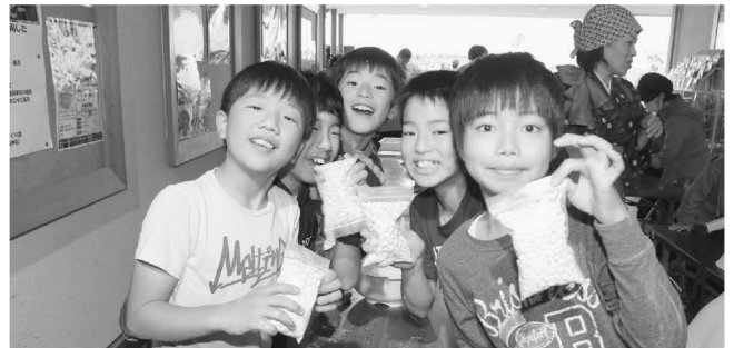
インドネシアの納豆「テンペ作り体験」！

当日は、仮装した来場者にプレゼントが配られたほか、甘酒・粕汁の無料配布、お米・野菜のつかみ取りや大抽選会など盛り沢山の内容でした。また、インドネシアの納豆「テンペ作り体験」にたくさんの方が集まりました。夜には音楽と共に花火があがり、秋の澄んだ夜空に上がるきれいな花火を楽しみました。