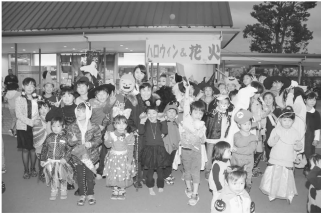
ハロウィンの衣装をした、たくさん子ども達