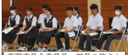
専門委員会委員長、部長の方々の皆さん