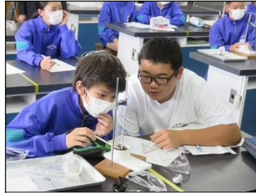
2年A組 理科の実験・保体の準備運動 集中しています！