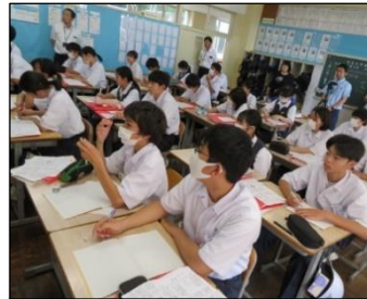
2年A組 国語・数学 集中力が増えています！