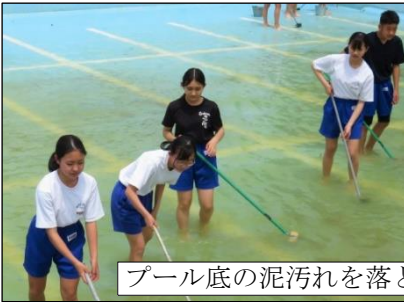
プール底の泥汚れを落とします！

6月5日（月）、3年生によるプール清掃（5月28日）に引き続き、2年生が一生懸命取り組みました。一人一人が頑張り、とてもきれいになりました。