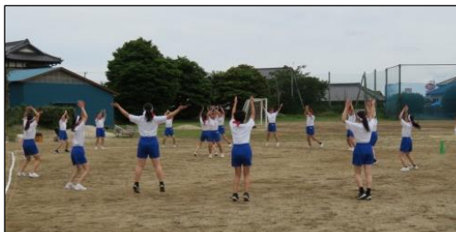
3年 保健体育 (女子) ソフトボール 投げる動作を覚えます！