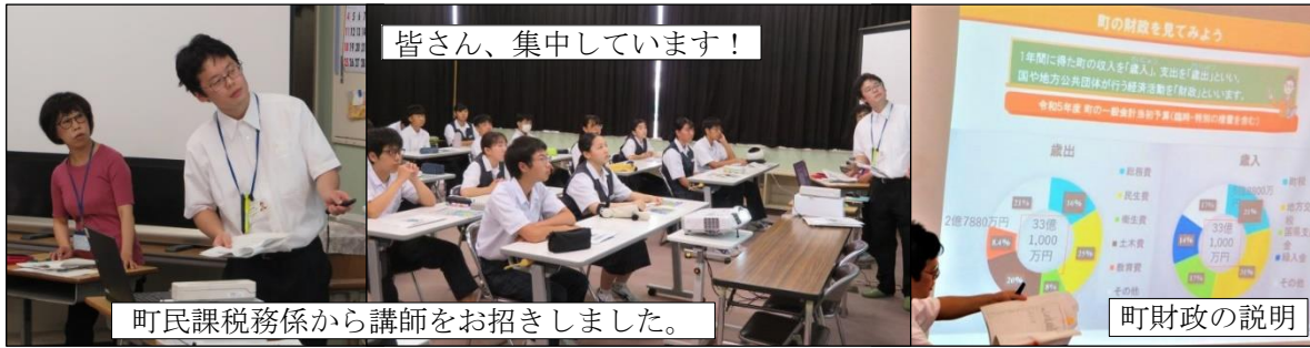
町民課税務係から講師をお招きしました。

6月23日(金)町民課税務係から講師を招き、3年生対象の租税教室を行いました。税金の種類やしくみ、国や町の財政の現状と問題点について学ぶよい機会になりました。夏休みに社会の課題で【 税の作文 】を書き、税についての関心を更に高めます。