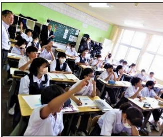
1年A組 数学・英語 積極的に取り組んでいます！

6月6日(火)～7日(水)にオープンスクール(保護者自由参観)、6日(火)に学校評議員会があり、授業等の様子を見ていただきました。