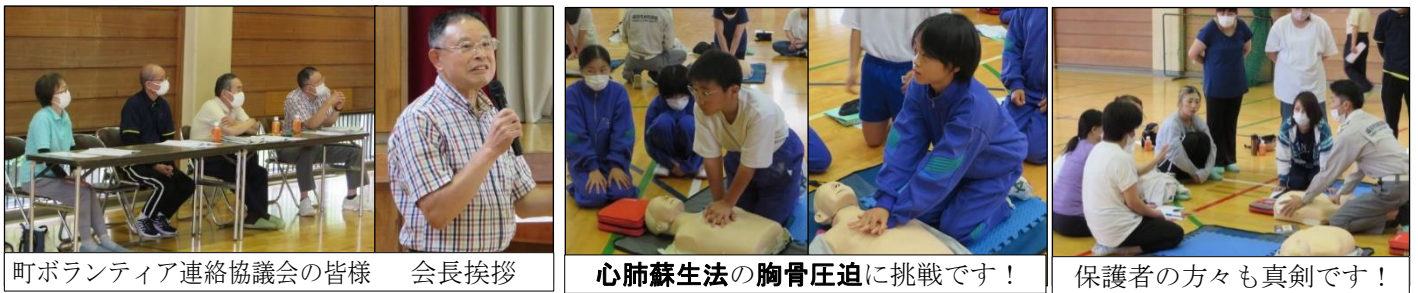
町ボランティア連絡協議会の皆様 会長挨拶

6月23日(金)神崎町ボランティア連絡協議会主催による「AED講習会」を1年生、及び家庭教育学級(ひさご学級)を対象に実施しました。神崎町ボランティア連絡協議会、神崎町社会福祉協議会、大栄消防署下総分署の方々のお陰で、実りある講習会となりました。貴重な体験をさせていただき、本当にありがとうございました。