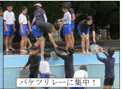
バケツリレーに集中！