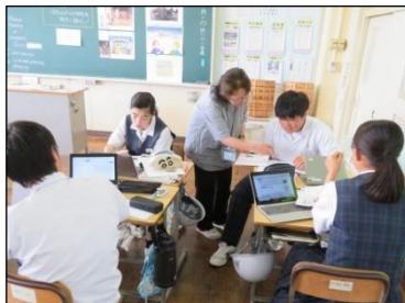
3年A組 英語 会話(スピーチ)力を高めています！