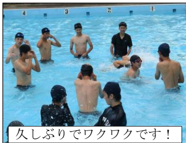
久しぶりでワクワクです！

6月16日（金）今年度の水泳授業が3年生から始まりました。自分たちできれいに清掃したプールで、元気に活動することができました。