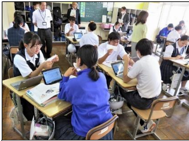
3年A組 英語・国語 タブレットを有効活用！