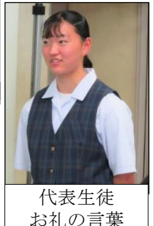
代表生徒 お礼の言葉

【令和5年度神崎町の一般会計当初予算】 33億1000万円 税金の使い道を意識しよう！