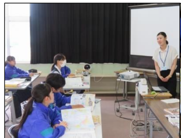
3年B組 社会 資料を活用する力を高めます！