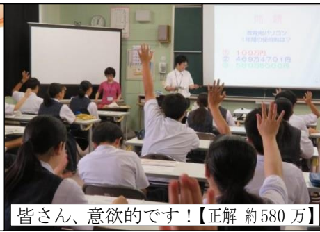
皆さん、意欲的です！【正解 約580万】