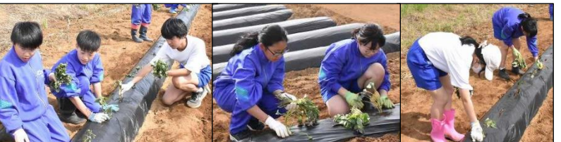
苗を1本1本丁寧に植えていきます。秋の収穫が楽しみです！