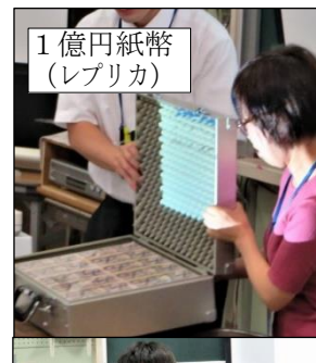
1億円紙幣 (レプリカ)