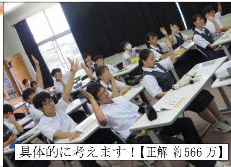
具体的に考えます！【正解 約566万】