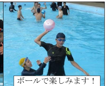
ボールで楽しみます！