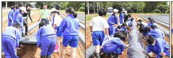
マルチシートを張って土をしっかりと被せます！