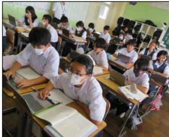
1年A組 国語・社会 意欲的に学習しています！

6月14日(水)、町教育委員学校訪問がありました。学校経営説明の後、授業参観をしていただきました。思考力・判断力・表現力(伝える力)を高められるよう、取り組んでいます！