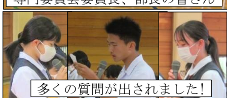
多くの質問が出されました！

神崎中学校生徒会歌 一 利根の若草 萌えいでて 大地に生氣 満つるとき 独立自主の 旗をたて ここに集える 若人が 高き理想に 眉をあげ あこがれ望む 筑波山 二 湧けよ夏雲 野は広し 強き日ざしは 照らすとも 真理のとびら ひらくべく ともにいきおう 若人が 先人の道 かえりみて 新しき世を 築きゆく