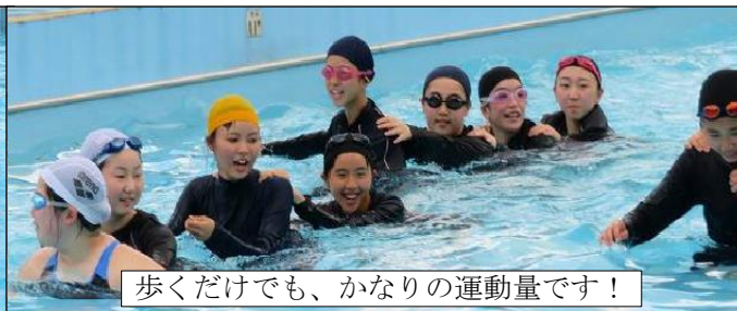
歩くだけでも、かなりの運動量です！