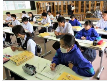
3年B組 社会・音楽 落ち着いて取り組んでいます！