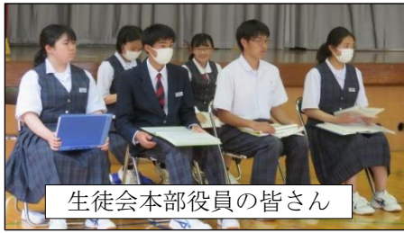
生徒会本部役員の方々の皆さん