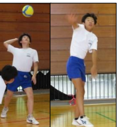
(男子) バレーボール パワー全開です！