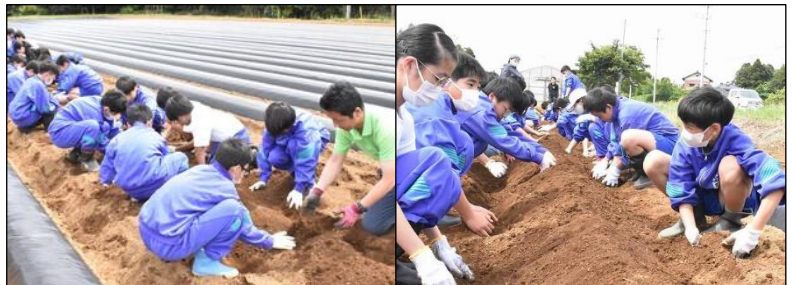
手作りの畝を手作業で1本作りました。皆の協力に価値あり！