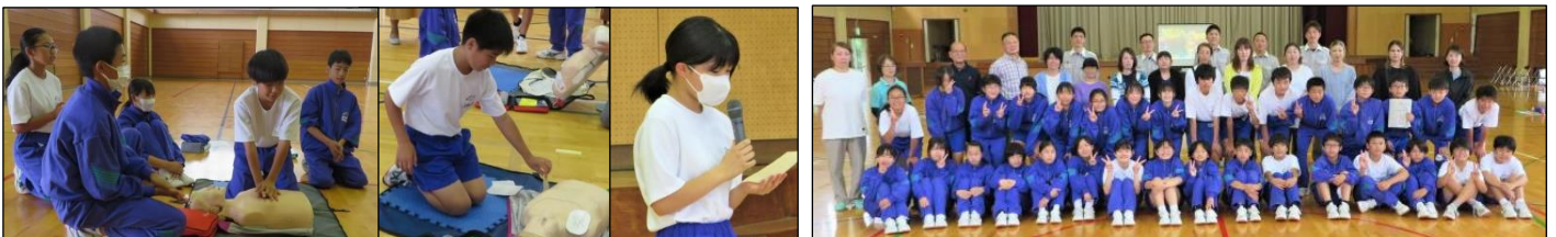
保護者の方々も真剣です！