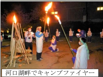
河口湖畔でキャンプファイヤー