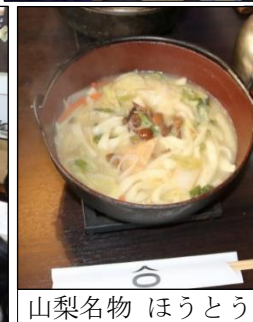
山梨名物 ほうとう