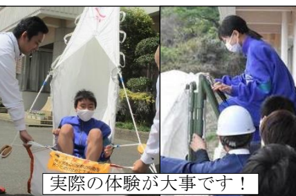
実際の体験が大事です！