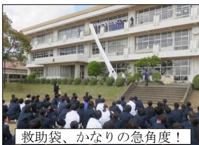
救助袋、かなりの急角度！

避難の心得『お・す・し・も』をしっかり意識して避難できました。実際の火災では パニック状態が予想 されるので、特に『お・し（おさない、しゃべらない）』が大事です。 ※ 素早く、戻らない