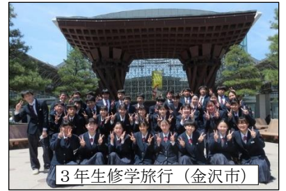
3年生修学旅行（金沢市）