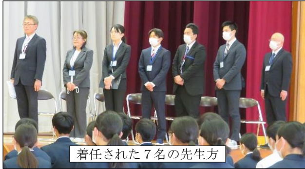
着任された7名の先生方

4月6日（木）着任式が行われ、7名の新しい先生を迎えました。一人一人から自己紹介、お話をいただきました。