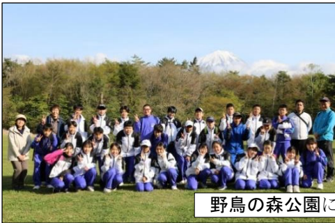
野鳥の森公園に到着 背景に富士山