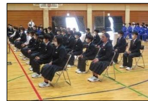
集中して話を聞く新入生