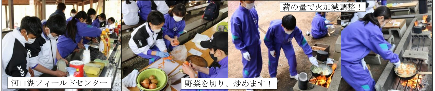
河口湖フィールドセンター

4月23日(日)～24日(月)2年生宿泊体験学習が行われました。1日目は河口湖フィールドセンターでの飯盒炊さん、西湖コウモリ穴見学、青木ヶ原樹海散策、夜はキャンプファイヤーと充実した体験ができました。2日目は、クラフトの里ダラスヴィレッジでマグカップの創作体験、忍野八海見学、昼食は楽しみにしていた山梨名物『ほうとう』を頂き、二日間充実した時間を過ごすことができました。また、富士山と河口湖の素晴らしい景色もよい思い出になりました。