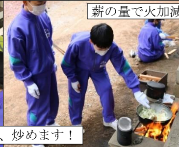
薪の量で火加減調整！