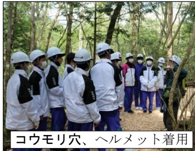
青木ヶ原樹海 散策