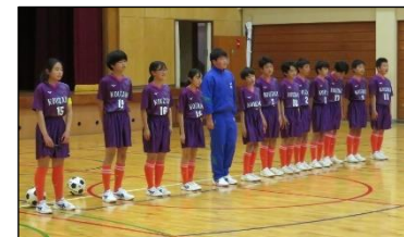
【サッカー部 一心不乱！】