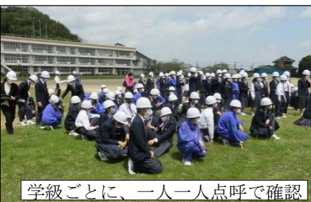
学級ごとに、一人一人点呼で確認