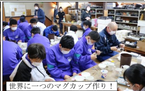
世界に一つのマグカップ作り！