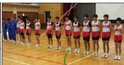
【ソフトテニス部 爽汗！】