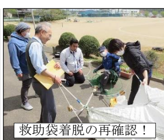
救助袋着脱の再確認！

【生徒への確認（昨年の復習）】火災による死亡原因は、火傷の他に何が一番多いでしょうか。一酸化炭素中毒です。一酸化炭素は無色・無臭で臭いがしないので気が付かず、途中で意識がなくなり倒れてしまいます。ハンカチ等で口をしっかりと押さえ、煙を直接吸わないようにしましょう。