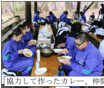
協力して作ったカレー、仲間との野外昼食は最高！