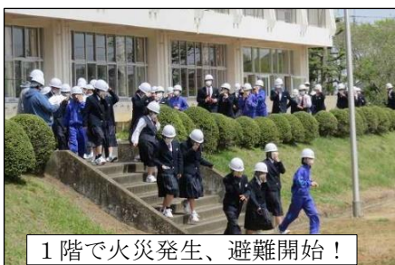
1階で火災発生、避難開始！

4月12日（水）火災想定避難訓練を行いました。避難経路、避難方法を確認して、安全かつ迅速に避難できる実践的な訓練となりました。特に今回は、避難袋を用いた降下訓練を行い、専門家の指導の下、正しい使用方法について学びました。