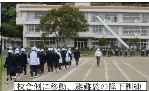
校舎側に移動、避難袋の降下訓練

避難の心得『お・す・し・も』をしっかり意識して避難できました。実際の火災では パニック状態が予想 されるので、特に『お・し（おさない、しゃべらない）』が大事です。 ※ 素早く、戻らない