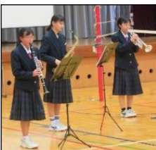
【吹奏楽部 心に響く演奏を！】