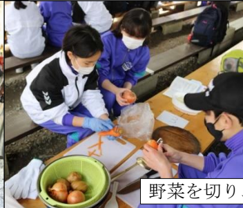
野菜を切り、炒めます！