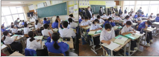
1年A組 国語 意欲的に取り組んでいます！

6月16日(木)、神崎町教育委員学校訪問がありました。学校経営説明の後、授業参観をしていただきました。落ち着いて学習できる集中力で、思考力を更に高めていきましょう！