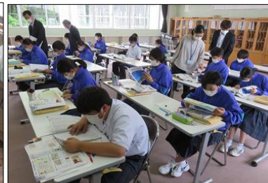
2年A組 社会 歴史の学習 英語 発音に集中！