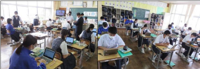
3年A組 英語 タブレットを使って発音練習です！