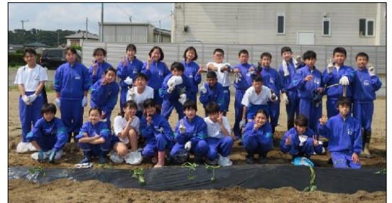
記念撮影 頑張った後は「気持ちいい！」