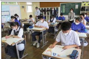
2年B組 家庭科 食品添加物の学習 よく考えています！