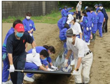
シートをはっていきます！