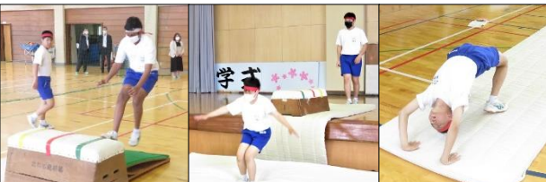
3年生 保健体育の選択授業 器械運動に挑戦！