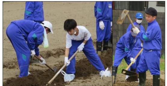
自分たちでも1本の畝をつくりました！