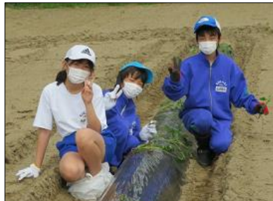
苗は斜めに植えます、なぜ？