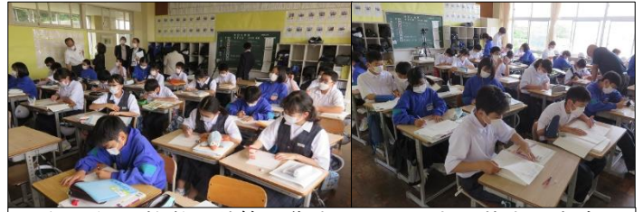
1年A組 数学 計算に集中しています。基本が大事！