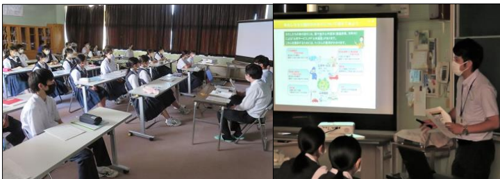
税金の種類や使い道について丁寧に説明してくれました！

6月24日(金)町民課税務係の職員2名を講師に招き、3年生対象の租税教室を行いました。税金の種類やしきみ、国や町の財政の現状と問題点について学ぶよい機会になりました。夏休みに社会の課題で【税の作文】を書き、税についての関心を更に高めます。