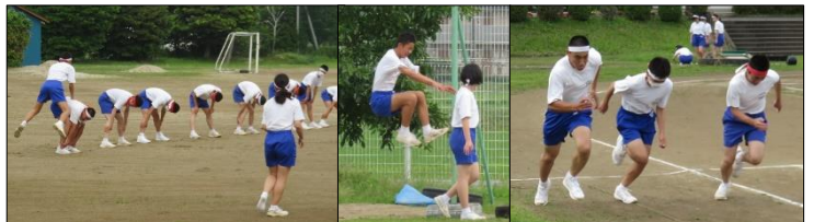
陸上競技 短距離、走幅跳、走高跳、砲丸投に挑戦！