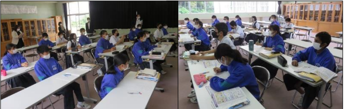
3年B組 社会 少子高齢化は、重要な課題です！