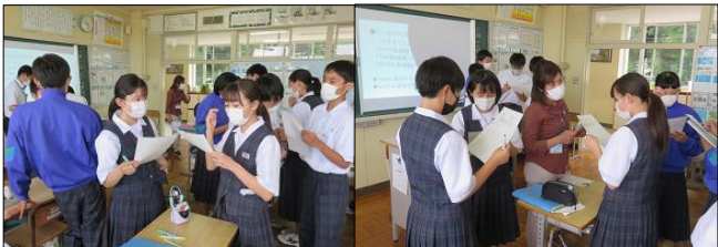
2年A組 英語「I want to ~」会話練習です！