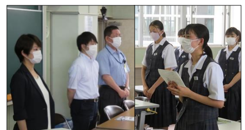
代表生徒によるお礼の言葉