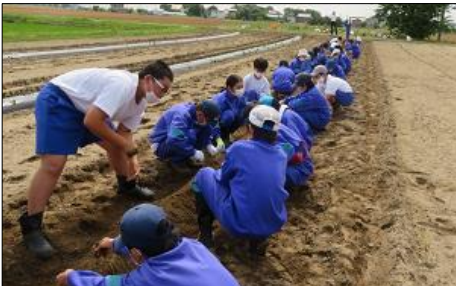
みんなで土を盛り上げています！