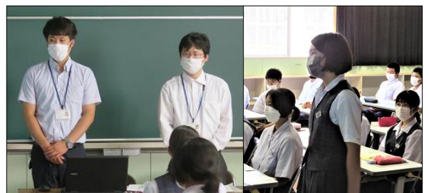
代表生徒によるお礼の言葉