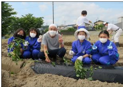
1本1本丁寧に苗を植えます！

10月には、香取特別支援学校の生徒たちと協同での芋掘り会を予定しています。また、夏休みに1年生で草刈りを実施します。