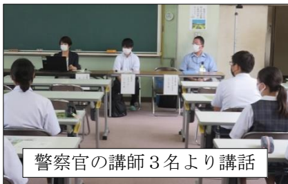
警察官の講師3名より講話

6月23日(木)、千葉県警察北総地区少年センター等から警察官の講師3名を招き、3年生を対象に薬物乱用防止教室を開催しました。薬物乱用の怖さを知り、絶対に手を出さない心を育てる手立てとなりました。また、SNSで気を付けること、暴力団の実態についても分かりやすく説明していただきました。