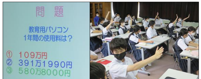
教育用パソコン1年間の使用料は？ 580万8000円