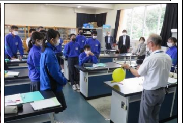
3年B組 理科 興味津々！