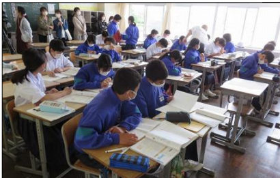
1年A組 数学の学習 技術は製図に取り組んでいます！

6月7日（火）～8日（水）にオープンスクール（保護者自由参観）、7日（火）に学校評議員会があり、授業等の様子を見ていただきました。