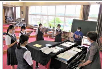
3年A組 音楽 素敵な歌声！