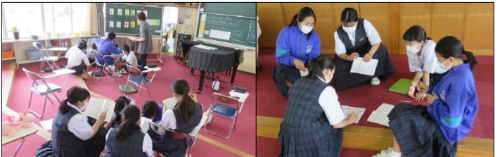
2年B組 音楽 パート別に曲の特徴の話合いです！