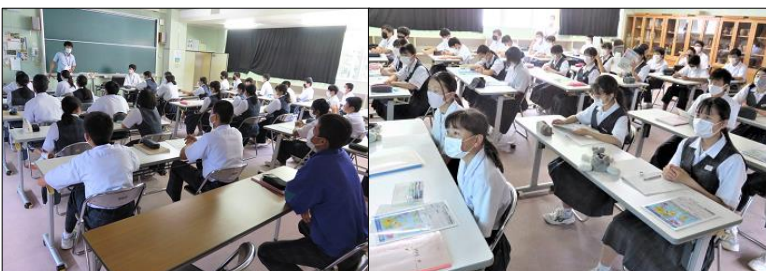
皆さん、資料を見ながら説明を集中して聞いています！