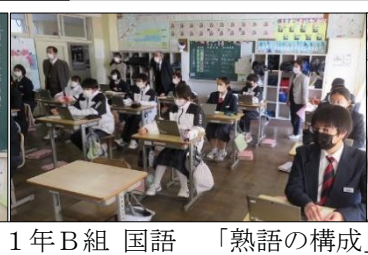
1年B組 国語 「熟語の構成」