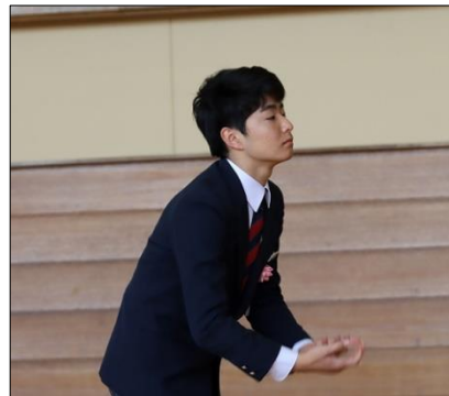
名指揮者による心の合唱です。