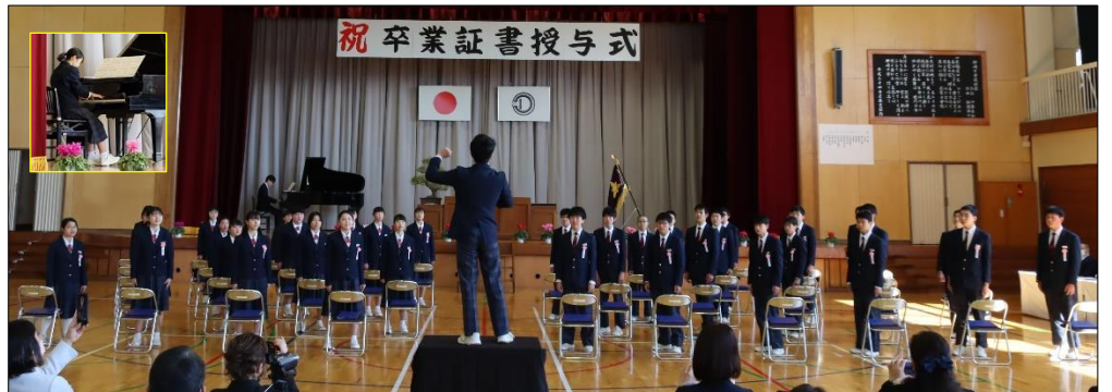
卒業式歌合唱 『旅立ちの日に』 『大地讃頌』 感動の歌声でした！