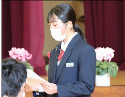
在校生送辞・・・卒業生との懐かし い思い出や感謝を伝えました。