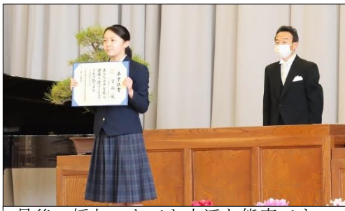
最後の授与。とても立派な態度です。