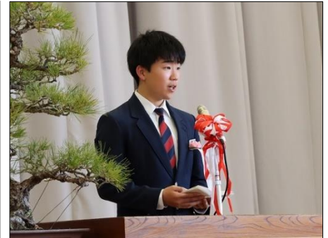
卒業生答辞・・・心のこもった すばらしい答辞でした。