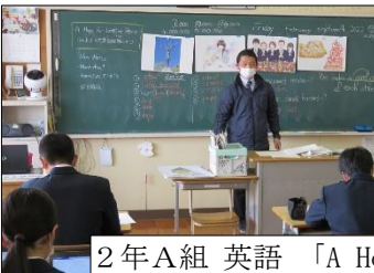
2年A組 英語 「A Hope for Lasting Peace」