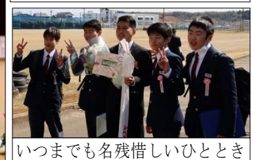
いつまでも名残惜しいひととき