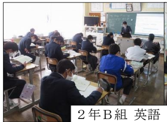
2年B組 英語 「現在完了形」