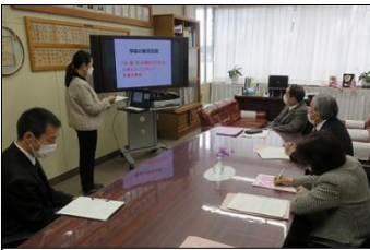
教務主任より今年度の取組の説明

2月18日(金)、第2回学校評議員会が開催されました。評議員の皆様には、授業参観していただいた後、学校運営に関して貴重な意見をいただきました。今後の改善に役立てていきます。