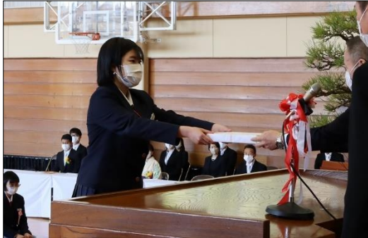
卒業記念品贈呈・・・神崎町から卒業生 一人一人に、印鑑が贈られました。