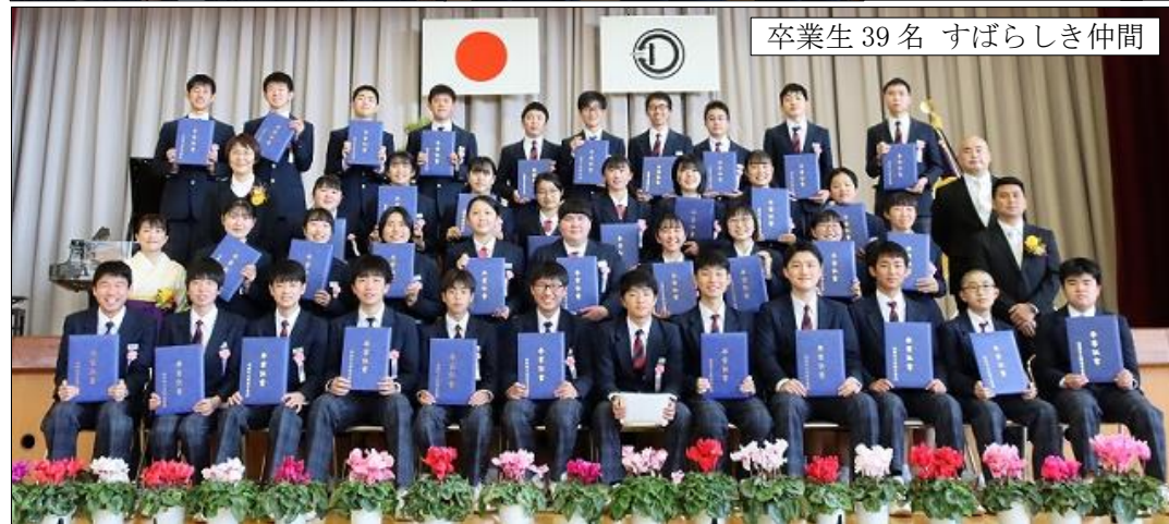
卒業生 39名 すばらしき仲間