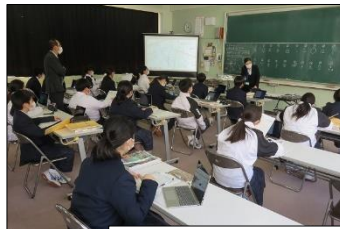
1年A組 社会 「社会・地域調査の方法を学ぼう」