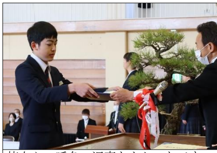
皆さん、呼名の返事もよかったです。