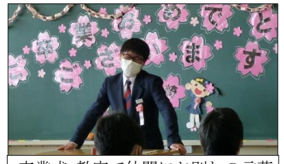
卒業式 教室で仲間にお別れの言葉

令和4年2・3月号 【学校教育目標】「知・徳・体」の調和がとれた、心身ともにたくましい生徒の育成