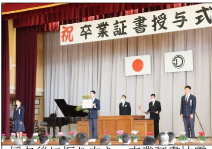
授与後に振り返り、卒業証書披露