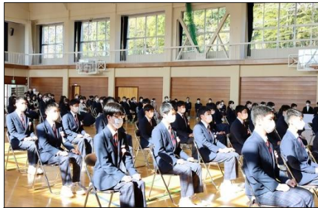
厳粛な空気が漂っています。