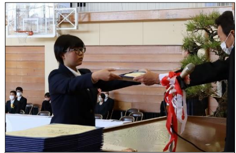
卒業証書授与 心を込めて授与しました。