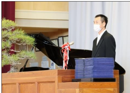
「開式の言葉」歴史を重ね75回