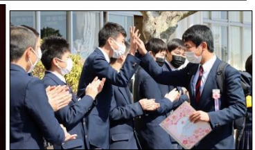
先輩から後輩へハイタッチ！