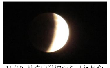
11/19 神崎中学校から見た月食

令和3年11月号 【学校教育目標】「知・徳・体」の調和がとれた、心身ともにたくましい生徒の育成