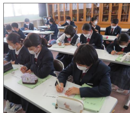
一人一人が食事の目標を記入！