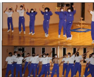
スタンプ 盛り上げます！