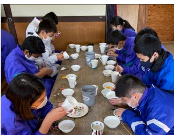
マグカップの創作体験