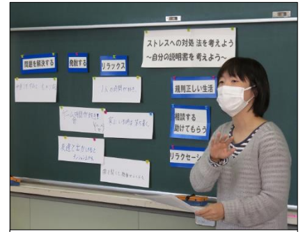
養護教諭から丁寧な説明と助言

(ストレスラー) 人間関係、テスト勉強、体の変化、親とケンカ、睡眠不足、疲れ、体調不良 など