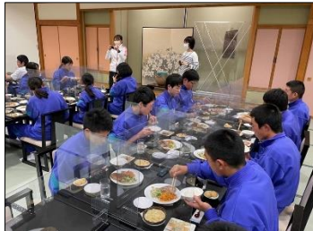
ホテルの夕食、黙食です！