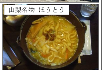
山梨名物 ほうとう