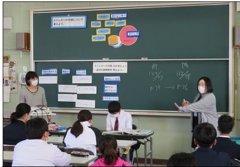
SCさんから『リラクゼーション』の説明

(ストレスラー) 人間関係、テスト勉強、体の変化、親とケンカ、睡眠不足、疲れ、体調不良 など