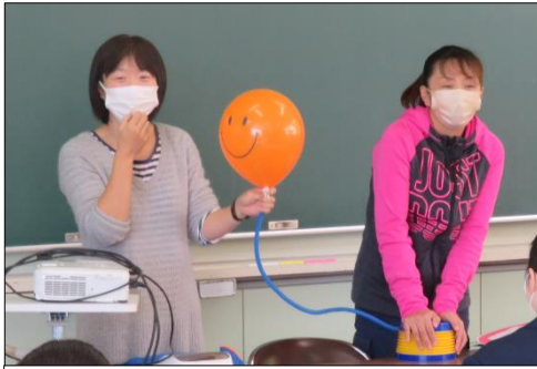
ストレスのイメージは『心の風船』

11月11日（木）1年生保健の授業で『ストレス対処法』を学びました。保健体育教諭、養護教諭、スクールカウンセラー（SC）のコラボレーションによる内容の濃い授業でした！