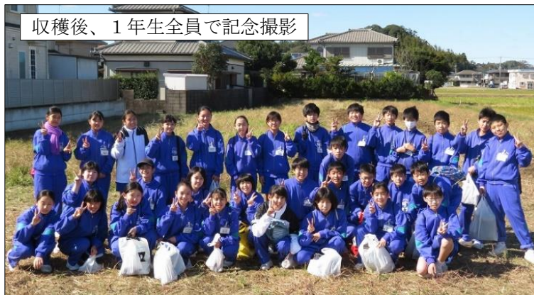
収穫後、1年生全員で記念撮影