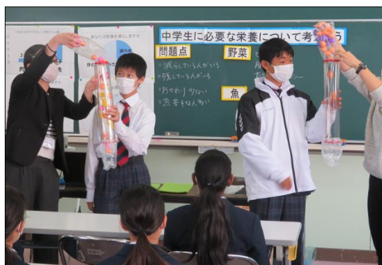
『血管の流れ方』についての実演です！