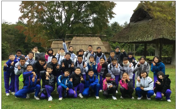
『青木ヶ原樹海』を散策後、『野鳥の森公園』に無事到着！ 雨は上がり、学年での全体写真です！