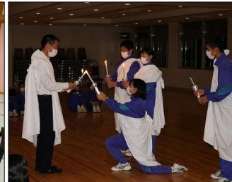
聖なるキャンドルサービス