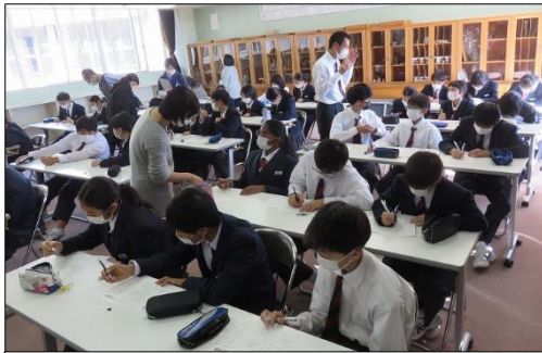
自分のストレス対処法を考えています！