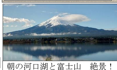
朝の河口湖と富士山 絶景！