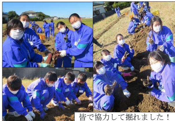
皆で協力して掘れました！

この芋掘り交流会は、畝作りから苗植え、除草作業に至るまで、地域の方々の多大なご協力があってこそ、実現しました。本当にありがとうございました。生徒共々、感謝申し上げます。