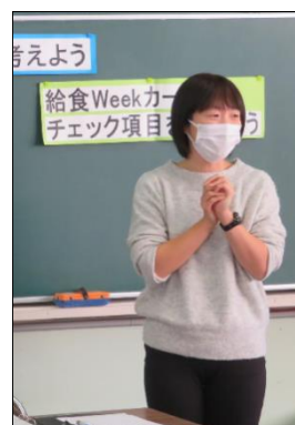
長滝養護教諭の説明