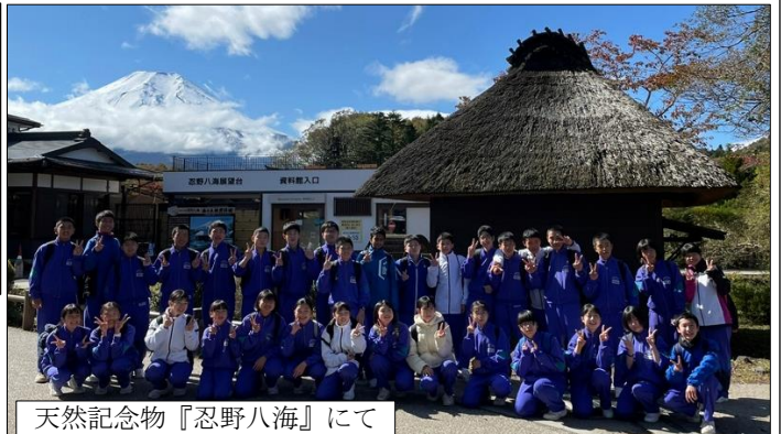
天然記念物『忍野八海』にて