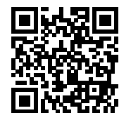
連絡メール2 保護者ログイン

学校・お子様の追加やその他登録内容を変更する場合 右記の「保護者ログイン用二次元コード」を読み取り、保護者サイトに接続します。 * その際、登録したメールアドレスとログインパスワードを入力します。 * 保護者サイト https://renraku.education.ne.jp/parent/ パスワードを忘れた場合 上記登録と同様に空メールを送信すると、パスワードの再設定ができます。 * 保護者登録しているメールアドレスがご利用できない場合は、パスワードの再設定ができません。