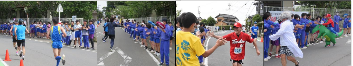
「10kmの部」参加のランナーが、どんどん戻ってきました。ハイタッチでラストスパート！