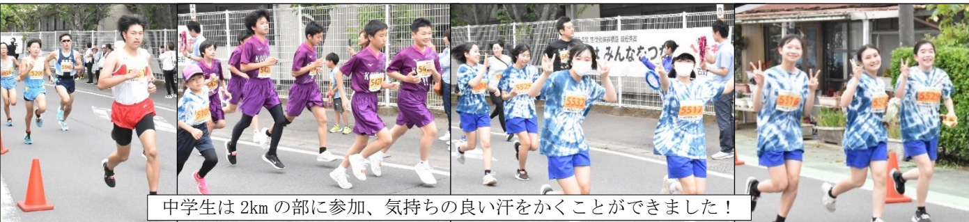
中学生は2kmの部に参加、気持ちの良い汗をかくことができました！