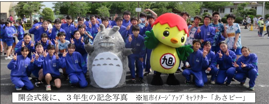
開会式後に、3年生の記念写真 ※旭市イメージアップキャラクター「あさabee」