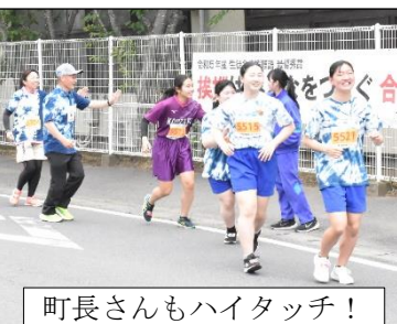
町長さんもハイタッチ！