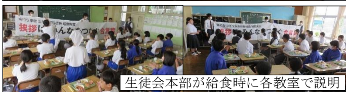
生徒会本部が給食時に各教室で説明