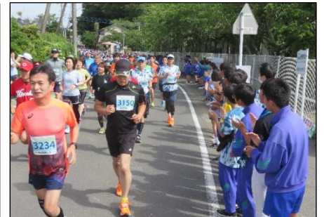
学校に戻り「10kmの部」応援！