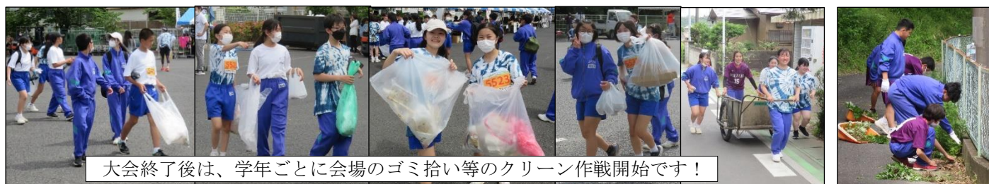
大会終了後は、学年ごとに会場のゴミ拾い等のクリーン作戦開始です！