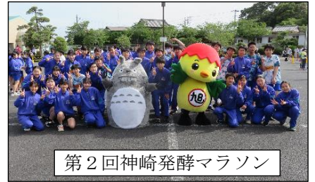
第2回神崎発酵マラソン

【学校教育目標】 「知・徳・体」の調和がとれた未知の状況に対応できる生徒の育成 検索 神崎中