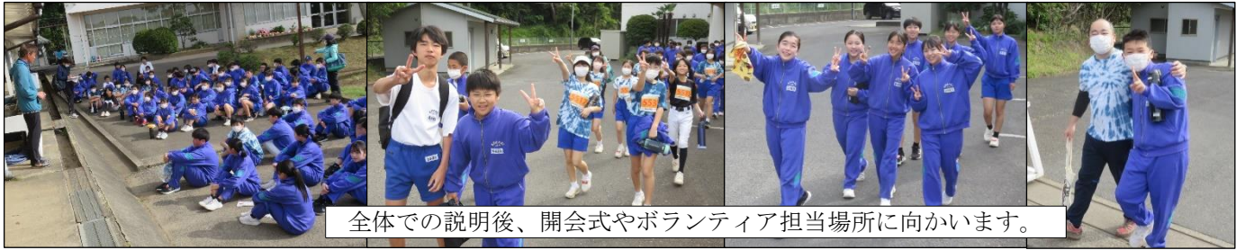
全体での説明後、開会式やボランティア担当場所に向かいます。

5月28日（日）第2回神崎発酵マラソンが盛大に行われました。生徒は、ランナーやボランティアとして参加し、応援もよく頑張りました。午後は、クリーン作戦として会場のゴミ拾いやプール清掃、校庭の除草作業を行いました。