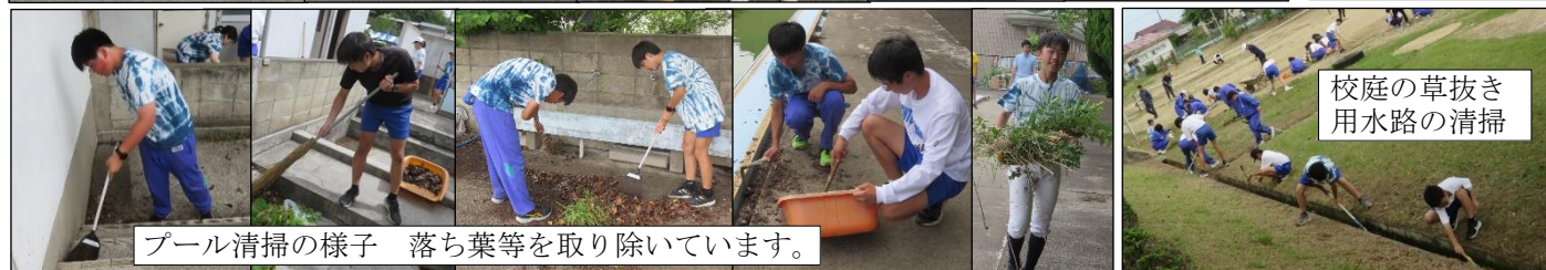
プール清掃の様子 落ち葉等を取り除いています。