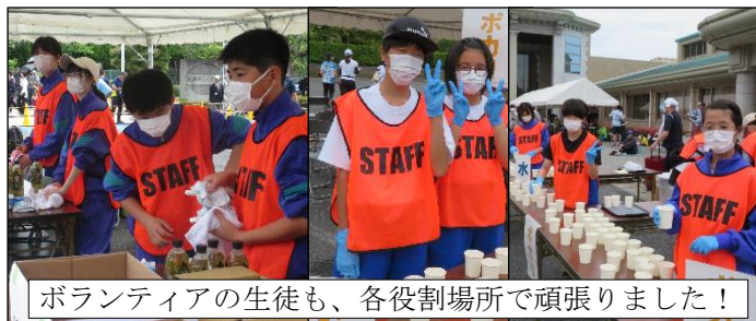
ボランティアの生徒も、各役割場所で頑張りました！