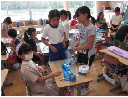
応援用のポンポン作り

さて、今週から運動会に向けての準備や練習が始まりました。まだ、夏の暑さが残る中ですが、無理せず、熱中症に十分気をつけて練習をすすめていきます。本年度は、運動会の開催時期を昨年度より2週間ほど遅らせ、9月30日（土）に開催します。また、児童の体力等を考慮し、昨年度同様に午前中開催とします。ご理解とご協力の程、よろしくお祈いします。