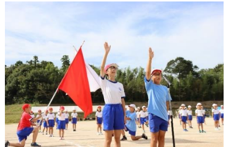
【6年生のリーダーシップが発揮された運動会になりました。】

ある日の昼休み、私とその草を集めていると、遊んでいた上学年の児童が「校長先生、手伝います。」と言って、進んでお手伝いをしてくれ、その姿を下学年の児童が見ていました。子どもたちのおかげで短い時間で草を集めてきれいにすることができました。また、ある日の下校時、「校長先生、学校をきれいにしてくれてありがとうございます。」と上学年の児童から声をかけられ、それを下学年の児童が聞いていました。神崎小学校のやさしさのバトンは、このように受け継がれていくんだなあと考えた場面でした。