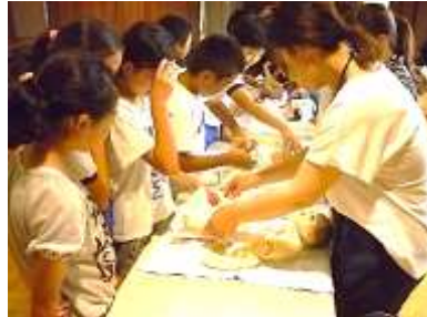
おむつを替える体験