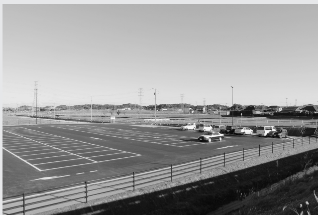
昨年12月に舗装を行った高速バス利用者駐車場

道の駅発酵の里こうざきに、高速バス利用者駐車場を整備しましたので、高速バスをご利用される方は、高速バス利用者駐車場をご利用ください。