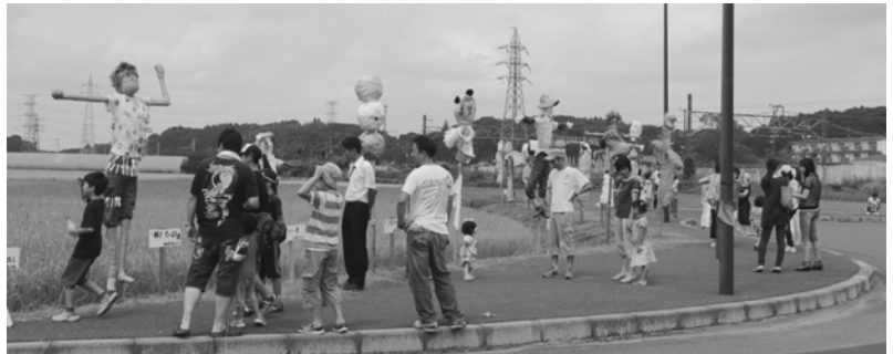
表彰式はたくさんの人で賑わいました