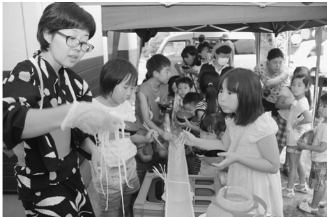
恒例の流しそうめんは子ども達に大人気