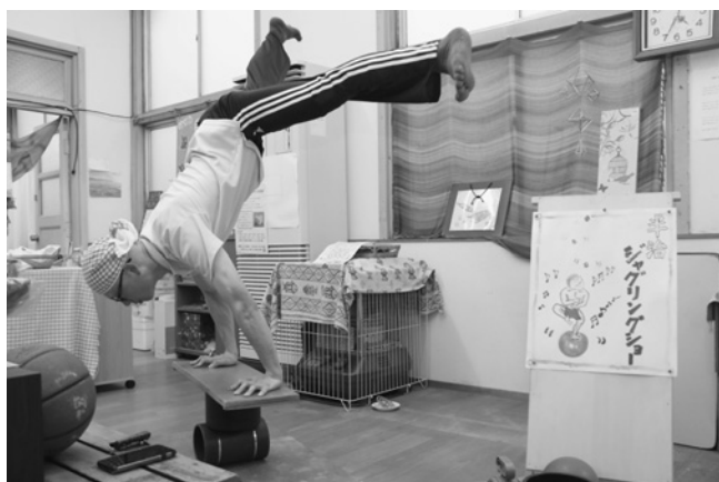
すご技連発のショーに来場者も大盛り上り