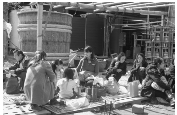
最優秀賞「ひとやすみ」

3月の酒蔵まつりで撮影された写真を対象としたコンテストが実施され、受賞作品が決定しました。多数の応募の中から、最優秀賞以下46点が選出され、神崎ふれあいプラザに展示されました。