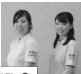
ポロシャツを着用した職員

夏の節電対策の一環として、職員が着用するポロシャツを作成しました。ポロシャツの左袖には「発酵の里こうざき」のロゴをあしらひ、出張やイベントの際にも着用して発酵の里をPRします。暑い夏をクールビズで乗り切り、神崎町のさらなる発展を目指します。