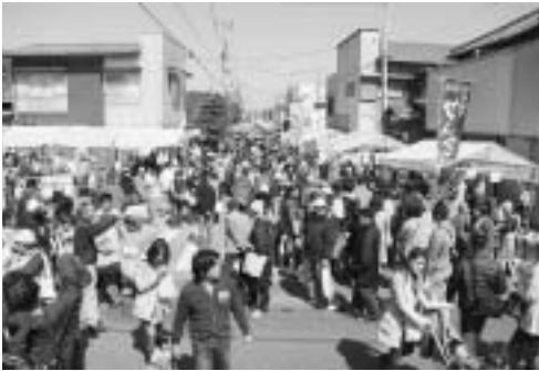
国道は歩行者天国になります