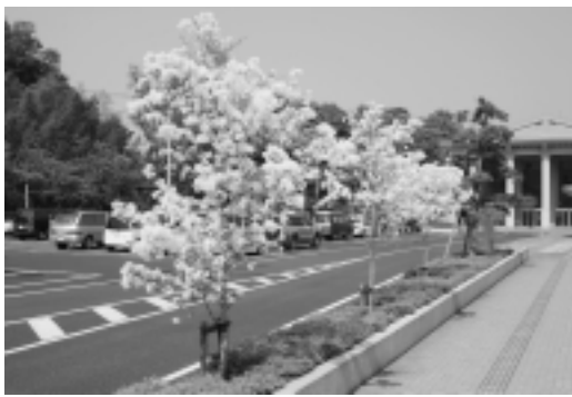
5月上旬神崎ふれあいプラザ前に咲いた満開のヒトツバタゴ

神崎町のシンボルとして神崎神社のなんじゃもんじゃの木(くすのき)は広く知られておりますが、もっと神崎町を内外にアピールするため、同じ名前を持つ白い花の咲く木(ヒトツバタゴ)を町内に植樹し、親しみとふれあいのあるまちづくりにを昨年より進めています。推進委員会では、今年も苗木を購入するため「花の咲くなんじゃもんじゃ植樹募金」を行います。この募金の趣旨に賛同していただけますよう皆さまのご理解とご協力をお願いします。