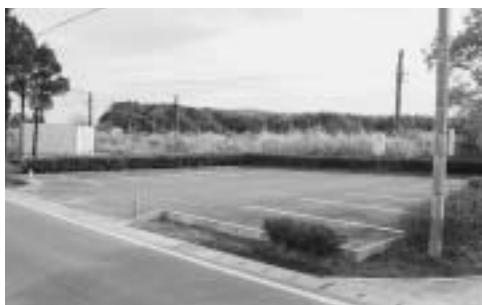
下総神崎駅前東側町営駐車場の場所