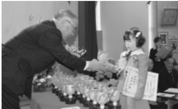
米沢保育所卒園式にて保育証書等の授与