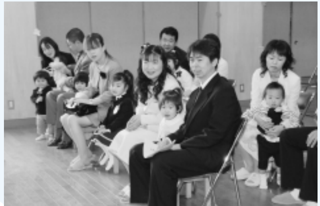
米沢保育所 (5名入所)