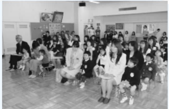
神崎保育所 (19名入所)