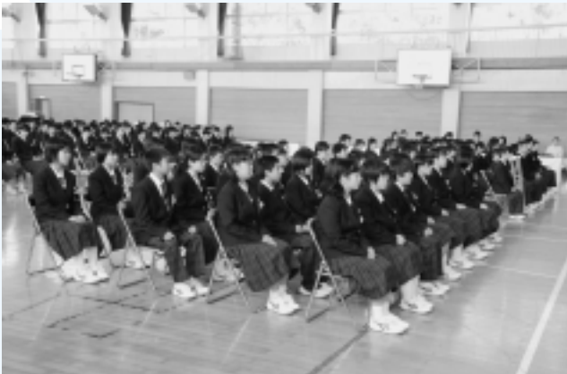
神崎中学校 (65名入学)