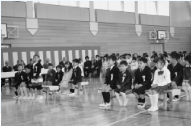
米沢小学校 (17名入学)