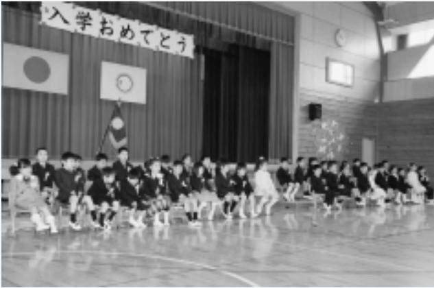
神崎小学校 (40名入学)