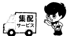
企画・広告提供 酒井クリーニング

「このチラシを女性の方にお渡し下さい。」 全ての運営費は独身男女の参加費と協力店で運営しています。