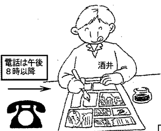
電話は午後8時以降